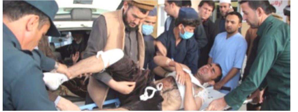
فريق إنقاذ يحيط جريحا في التفجير

كابول (ا ف ب) - ارتفعت حصيلة التفجير الذي استهدف تجمعا انتخابيا في شمال شرق أفغانستان السبت إلى 22 قتيلا على الأقل بحسب ما أعلن مسؤولون اأحد، وسط مسخاوف في تصاعد أعمال العنف قبيل الانتخابات البرلمانية المقررة في 20 تشرين. وقتل عشرات الأشخاص أو جرحوا في هجمات مرتبطة بالانتخابات في أنحاء أفغانستان السبت، فيما يصعد المتطرفون هجماتهم ضد العملية الانتخابية، وتفجرت نارية مفخخة وسط انصار تنظيمية يوسفجيد، المرشحة عن ولاية تخار (شمال شرق) بحسب ما أعلن الحاكم جيلاني فريد. وقتل طفل في التاسعة من العمر وعرض ام كما اصيب شخصان اخران بجروح في الهجوم. وادت اعمال العنف المرتبطة بالانتخابات التي ارجأت مرات عدة إلى مقتل او جرح مئات الأشخاص