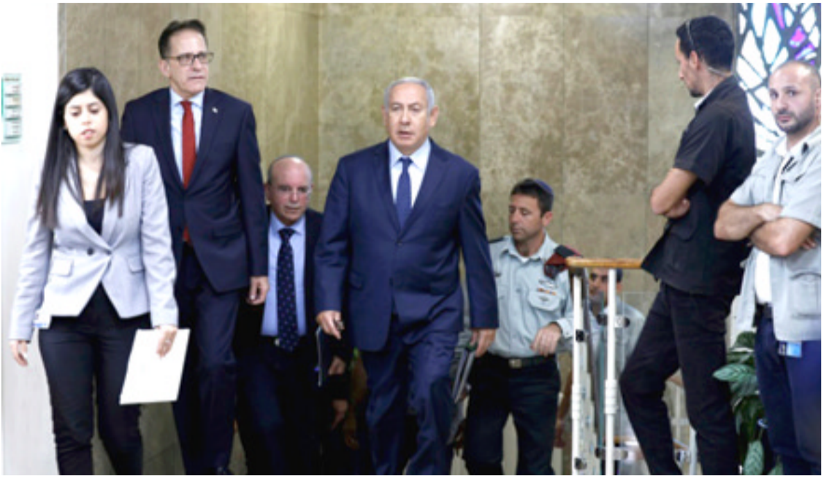
وصول : رئيس الحكومة الإسرائيلية بنيامين نتانياهو لدى وصوله للاجتماع الحكومي في القدس

وتشارك الأردن في التحالف الدولي بقيادة الولايات المتحدة الذي شن ضربات جوية على داعش في سوريا والعراق. وأوضح الملك ان الأردن دولة ذات رسالة، رسالة تستند إلى مبادئ النهضة العربية الكبرى في رفض الظلم والسعي للسلام والدفاء عن الإسلام الحنيف وتبني نهج الوسطية والاعتدال والتسامح والهدأة والانفتاح. وفي الشأن المحلي، قال الملك إنه من خلال متابعتي اليومية لقضايا الوطن والمواطن، وجدت حالة من عدم الرضا عن الليات التعامل مع بعض تحديات الحاضر. وأوضح ان عدم الرضا هذا، هو مع الأسف