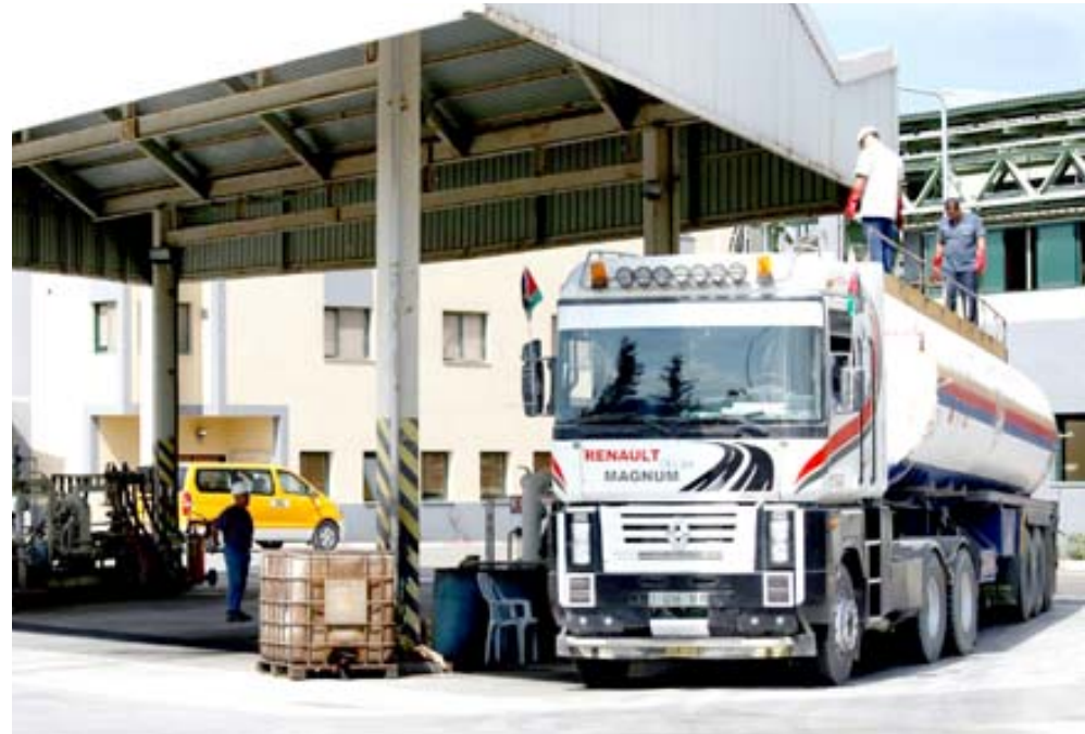
وقود : صهريج يفرغ الوقود في إحدى محطات التصيرات وسط قطا غزة

مناظرة لم تتم الموافقة عليها من قبل الجامعة ولم يتم اتباع السياسة المعتادة والمراجعة الخاصة للموافقة على فالعليات الطلاب. واضافت فيما ان الجامعة لم تصدق على اقامة الفاعلية، إذ لم يتم اتباع الاجراءات المتعارف عليها للموافقة على النشاط ، فقد تم الغاؤها. ستقوم الهيئات الاكاديمية المختصة بمراجعة الموضوع واتخاذ الاجراء المناسب . وجامعة جورجيتاون هي واحدة من عدة جامعات اميركية موجودة في الدولة.