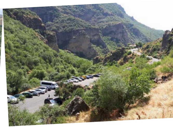
الجبال المحيطة بالبحيرة