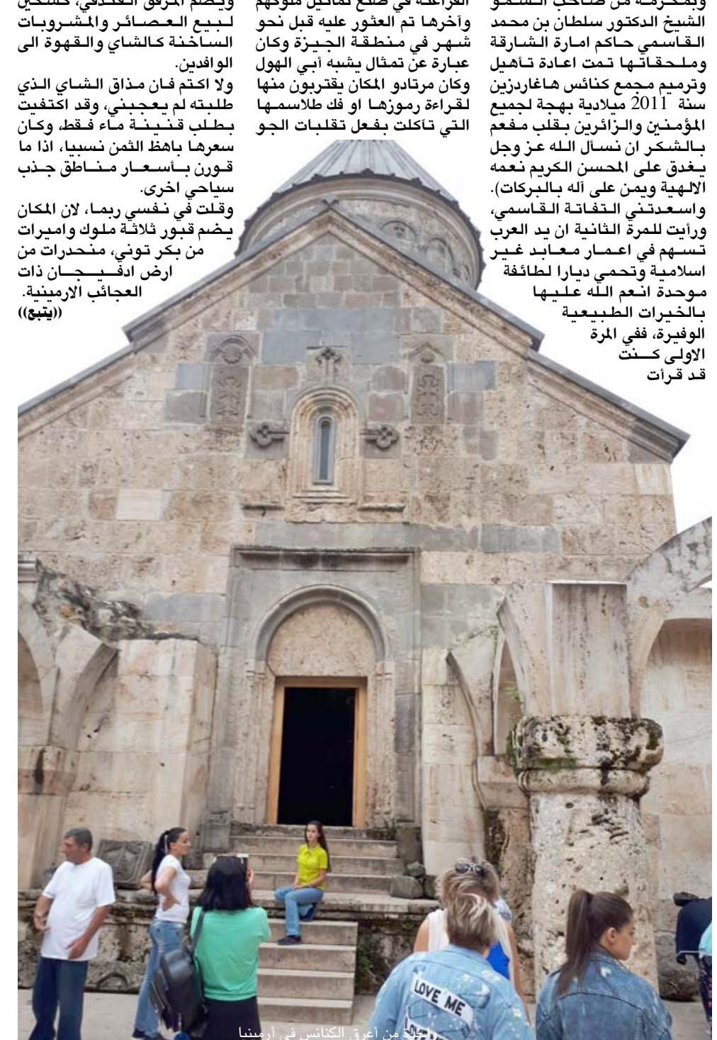
من اعرق الكنائس في ارمينيا

فالمناظر مغر والحيوية موجودة والمجال مفتوح ولا عوائق كونكريتية او (بسطة) نسبة الى البسطينيات، على الارصفة في شوارعنا، تحول دون المضي في معة المشي يوميا وفي جميع الاوقات. وقرات ان (اكتشاف ارمينيا من منطقة احدى اعلى العالم، ويبلغ ارتفاعها الف متر عن سطح البحر، وتشغل مساحتها المائية نحو 5 بالمئة من مساحة البلاد، وهي من بحيرات المياه العذبة في العالم. وساعة وصلنا اليها كانت رياح شديدة قد هبت بحيث اصبح في الغمغم على رايح ان يمسارس السباحة فيها، ورغم ان هذه الهواية تجرية فريدة في الايام الحارة، وباستثناء الزوارق السريعة التي تعوم فيها وبعض القوارب السياحية لم تصادف مغامرا واحدا يسبح في مياهها. لقد افقدت الرياح التي صاحبت هطول امطار متوسطة، القادمين وبعضهم يسكن مجمعات سياحية مخصصة للاقامة الطويلة، متعة العوم في مياه منعشة تتراوح حرارتها بين 22 - 18 درجة مئوية، وتمتاز بانها خالية من الملوحة. وعندما تكون السماء صافية تكتسي البحيرة لونا فيروزيا. وتنقل بعض الروايات عن الروائي السوفياتي العالمي مكسيم غوركي تشبيهه لبحيرة سفان بانها قطعة من السماء نزلت الى الارض لتتراح بين الطبيعة الجبلية لارمينيا حافلة بمناظر خلابة، لكني رأيت ان الجبال المحيطة بالعاصمة، تبدو شبيهة جدا، قريبة الشبه بجبال مدينة السلیمانية التي من النادر ان تغطيها الاشجار.