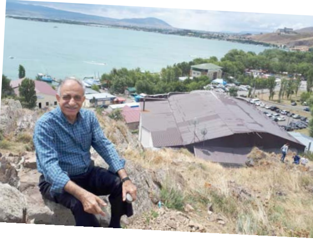
منتجع بحيرة سيفان