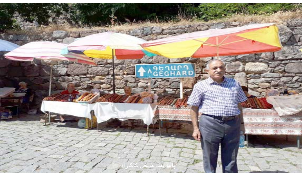
الخبز في كاتيك

والامطار. وتقول بعض المصادر ان (فن الخاشكار يمثل رمز الثقافة الوطنية في أرمينيا، أو فن نحت الصليب في الحجر الذي يمارسه منذ القرن الرابع، مباشرة بعد ان اعتنقت المسيحية، وكانت الأولى في اعتناقها.