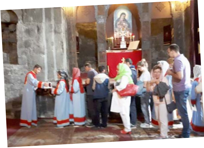
طقوس في كنيسة عمرها 400 سنة