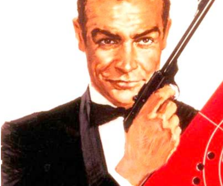
جيمس بوند .. فيلم لم ير النور

وشرعه المستعار عقب تمثيله دور بوند آخر مرة في فيلم 'الماس للأبد' عام 1971. ولم يسبق ان شارك كوني في كتابة سيناريو، ولم يجرها، وفورا ماكلوري اراد ان يقرن اسم كوني بمشروعه الخاص ببوند أيا كان السبيل، كما سرد روبرت سيلرز في كتابه 'مركبة بوند'. كاشفا تفاصيل الصراع بين فلمينج وماكلوري وشركة إيون من وراء كواليس المحاكم. وبغض النظر عن مدى إسهام كوني في هذا السيناريو، فقد أثار اهتمام شركة باراماونت فأرادت إنتاج الفيلم، بعنوان 'الراس الحربي'، والذي لا يخلو من إقارة، فرغم أن كتابه الثلاثة ساروا على الخطوط العريضة لـ'كرة الرعد' إلا أنهم أضافوا الجديد مستعينين أحيانا بمشاهد ساخرة على غرار افلام أوستن باورز.