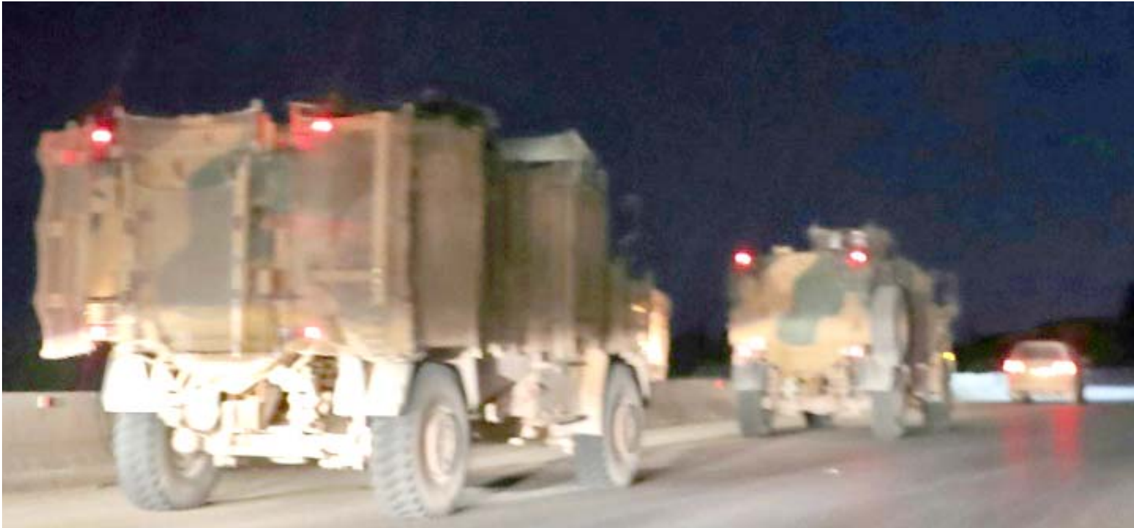
رتل؛ جانب من المركبات التركية تدخل إلى ادلب السورية

بالتدمير الكامل لـ كوربا الشمالية وشمتم زعيمها الذي وصفه "بـرجل الصواريخ" مما استدعى ردا من كيم الذي وصف الرئيس الأميركي بأنه مختل عقليا.