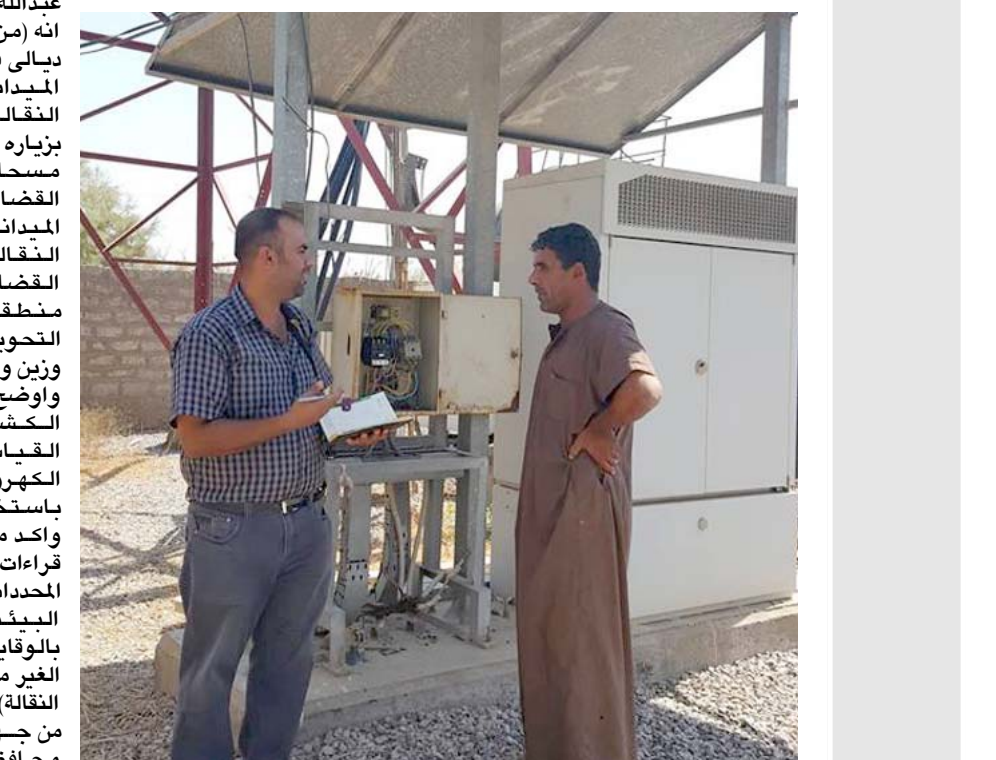
موظف البيئة يجري مسحا لأبراج الهوائف

يعرف حتى الآن كيف صرفت واين وكان مبالغ الميزانيات ضائعة). واذاف الدايني، ان (ما عرفناه ان الحكومة المركزية دعمت ديالى بمبالغ مالية خلال السنوات الاربع لكن المفاجئة اين ذهبت تلك الاموال مؤكدا بانها ستقدم مع نواب آخرين عن ديالى طلب رسمي الى هيئة النزاهة وديوان الرقابة المالي من اجل التحقيق للوقوف على حيثيات الموضوع وبيان حجم الاموال واين انفتت). و اشارت الدايني وهو نائبه عن