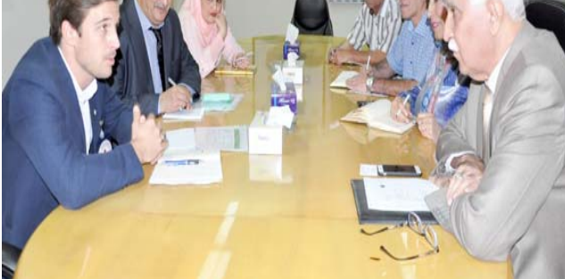
وكيل وزارة الزراعة خلال لقائه منسق الصليب الاحمر

المحلي للجمعيات الفلاحية،بالإضافة إلى ممثل عن الحكومة المحلية،ندوة إرشادية بعنوان (الإجراءات الوقائية لمرض الحمى النزفية). وقال بيان فان تلقته (الزمان) امس ان الندوة استهدفت مربى الثروة الحيوانية والعاملين في القطاع،وتمتعت تعريفيا عاما بالمرض،وطرق انتشاره،والإجراءات الوقائية المنجعة عند ظهور المرض،كما شهدت الندوة توزيع البوسترات والشترات الخاصة بالمرض. وفي الختام خرجت الندوة بعدد من التوصيات،منها دور الندوات الإرشادية في التحقيف،ومنع