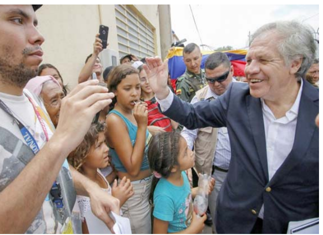
لقاء؛ الأمين العام لمنظمة الدول الأمريكية لويس ماثيو بلتي فنزويليين خلال زيارة إلى كوكيتا في كولومبيا

فنزويلا ستدين امام الامم المتحدة ومنظمات دولية أخرى الماغرو (...) بسبب قيامه بالتحريض على تدخل عسكري في بلدا واضراره بالسلم في امريكا اللاتينية والكارابي". وأضافت ان "الماغرو يوتي احياء اسوأ التدخلات العسكرية الامبريالية في منطقتنا التي يبذو