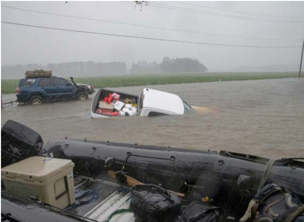
اعصار، مدينة لامبرتون في ولاية كارولينا الشمالية الأميركية بعد مرور الاعصار فلورنس

اعتقدون ان العاصفة لم تصل اليهم، لم يواجهوها بعد، محذرا بذلك سكان المناطق الجبلية في غرب الولاية بينما يتوقع ان يواصل الإعصار فلورنس تفرغه باتجاه الغرب السبت قبل ان يتعطف إلى الشمال الأحد. وتلقت بلدات عدة في كارولينا الشمالية وكارولينا الجنوبية السبت أوامر إخلاء خوفا من حدوث فيضانات.