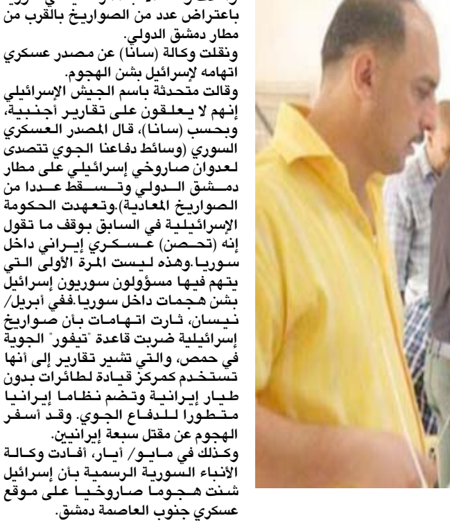
انتخابات؛ سوريون يدلون بأصواتهم في انتخابات محلية

وقالت وكالة الأنباء السورية (سانا) إن أكثر من اربعين ألف مواطن يتنافسون على "18 ألفا و 478 مقعدا في كل المحافظات".وعرض التلفزيون الحكومي السوري لقطات لناخبين يضعون الاوراق في مراكز التصويت بالقرب من دمشق وفي مدينتي طرطوس والاذقية (غربي) الساحليتين. وبعد أكثر من سبعة اعوام من حرب دامية وبمساعدة خليفة الروسي الذي يدعمه عسكريا، يسطر النظام السوري على حوالى ثلثي البلاد. لكن معارك ما زالت مستمرة في عدد من مناطق البلاد. وأسفر النزاع منذ انداعه في سوريا في 2011 عن سقوط أكثر من 360 ألف قتيل وادى إلى نزوح ملايين السكان من بيوتهم.