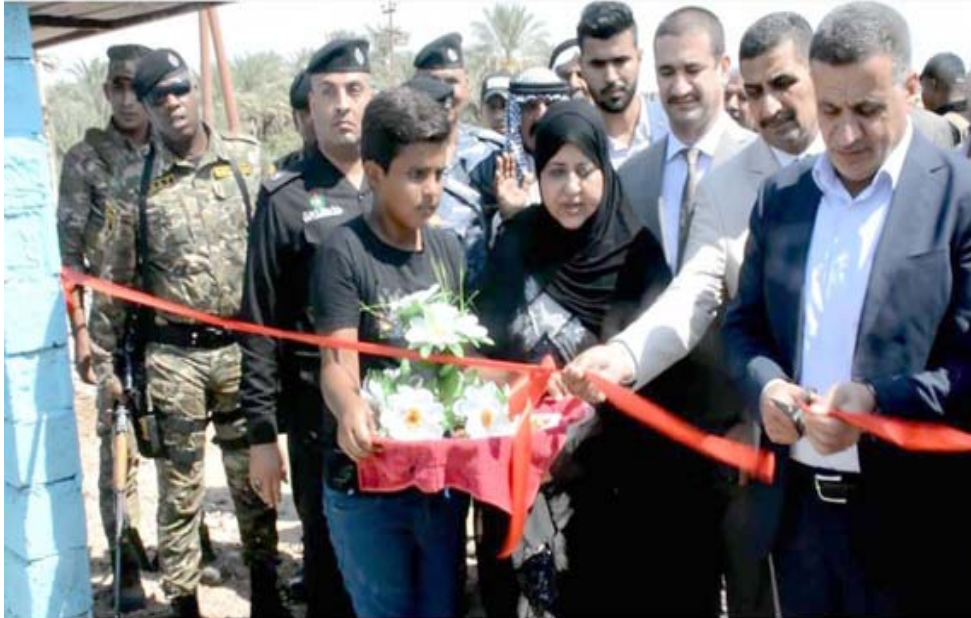
إفتتاح : محافظ ديالى يفتتح مشروعاً في المقدادية

دينار للساعة الواحدة واعتباراً من الأول من شهر ايلول الجاري ، إضافة الأضوية والنواحي (الاشرف الجابرتي من قبلهم) .