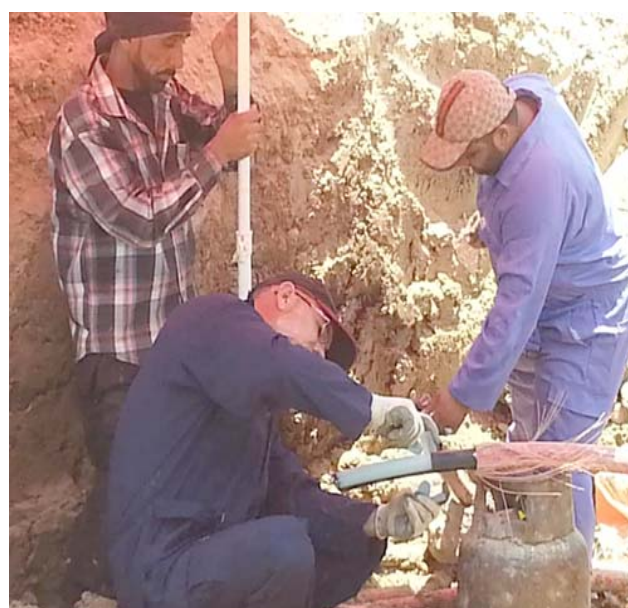
الاسلاك والقابلات والبوريات الخاصة بمكاتب الإنترنت،وتم مصادرة (200) متر من القابلات والمشترات من صناديق التوصيل والبوريات في احياء (المغني والفرات والسعد وحى ميسان وشيخ الحزام وشارع المطار والشارع الرئيسي كوفة/نجف)، كما توصل الملاكات الهندسية والفنية في فرع توزيع كهرباء وسط حملاتها برفع التجاوزات الحاصلة على الشبكة الكهربائية،إذ تم رفع (50) حالة تجاوز توزعت بواقع 23 منزلا متجاوز خط ناني و بدون مقياس 26 محلا تجاريا تجاوز خط ناني،إضافة الى

استخدام الإشارة،فضلاً عن السحب الشوائي للطاقة بعيداً عن إجراءات الربط الفنى الصورية) . وتواصل الملاكات الهندسية والفنية في فرع توزيع كهرباء النجف التابع للشركة العامة لتوزيع كهرباء الوسط حملاتها برفع التجاوزات الحاصلة على الشبكة الكهربائية. وشملت التجاوزات (تبادل أسط حملاتها برفع التجاوزات الحاصلة على الشبكة الكهربائية،إذ تم رفع (50) حالة تجاوز توزعت بواقع 23 منزلا متجاوز خط ناني و بدون مقياس 26 محلا تجاريا تجاوز خط ناني،إضافة الى