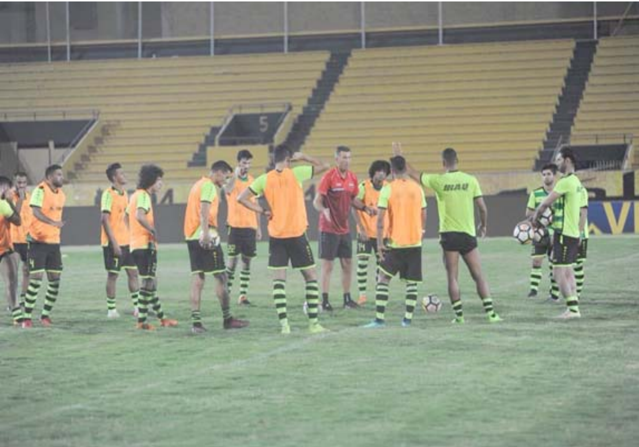
تدريبات المنتخب الوطني يستعد لمواجهة الكويت الودية عبر وحداته التدريبية

بعدها اثبتت الشكوك حول شخصيته التدريبية بأنه منقطع عن العمل من فترة طويلة وغيرها من الاتهامات نحو الرجل خلال المؤتمر الصحفي عند تقديم المدرب الذي نأمل ان يكون عند حسن ظن الجميع وان يظهر تأثيره عبر المشاركة ببطولة امم اسيا وشيء جميل ان يلعب منتخبنا الوطني مباراته اليوم مع المنتخب الكويتي التي تحمل معها ذكريات المواجهات السابقة للصراع الكروي بين المنتخبين ببطولة الخليج العربي وإحداها العالقة في الانهزام ليوم في جبل كروي قدم الكخبر لكرة العراقية والحال لكرة الكويتية التي قدمت الإسماء الكبيرة التي يتغنى بها الشارع الرياضي الكويتي باعتبار أن يظهر الأهمية للمباراة في ان تواجه المنتخبين ويستعدان تلك الأيام الجميلة عبر لقاء اليوم الذي نأمل ان يرتق لتطلعات الكل.