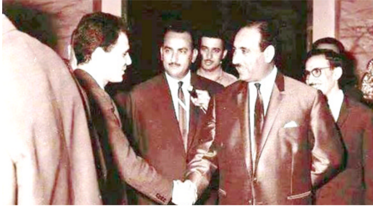
مصافحة: رئيس الجمهورية الأسبق عبد السلام عارف مصافحاً عبد الحليم حافظ في مدخل فندق بغداد