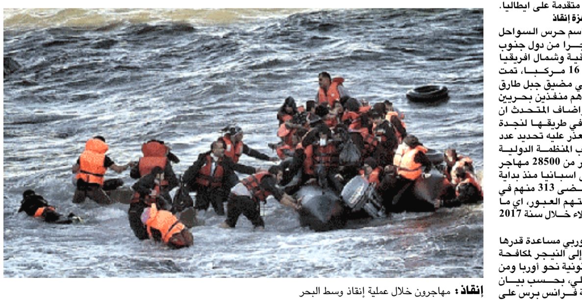
إنقاذ: مهاجرون خلال عملية إنقاذ وسط البحر

وقال متحدث باسم حرس السواحل ان 626 مهاجراً من دول جنوب الصحراء الأفريقية وشمال أفريقيا كانوا على متن 16 مركباً، تمت نجدهم الاثنين في مضيق جبل طارق وبحر اليونان أهم منفذين بحريين إلى اسبانيا، وازداد المتحدث ان مركب آخر لكن تعذر عليه تحديد عدد ركابه. وبحسب المنظمة الدولية للهجرة فإن أكثر من 28500 مهاجر وصلوا بحرا إلى اسبانيا منذ بداية 2018 في حين قضى 313 منهم في البحر عند محاولتهم الجيور، أي ما يفوق عدد هؤلاء خلال سنة 2017