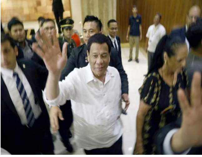
وصول الرئيس الفلبيني رودريغو دوتيرتي في مدينة القدس التي وصفاها

نتيهاو يبحث الأوضاع في سوريا وإيران مع موفد واشنطن