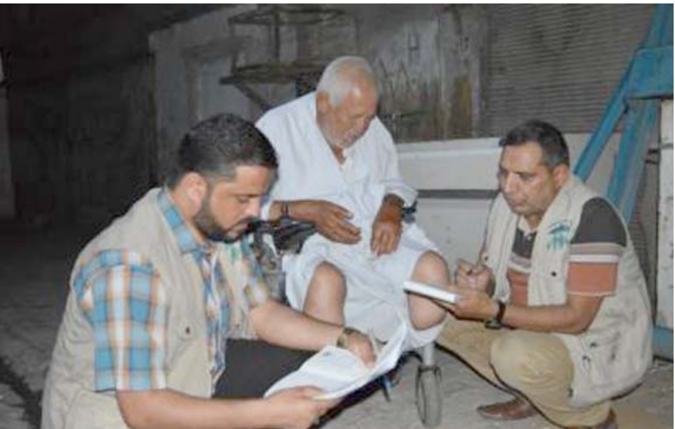
زيارة فريق وزارة العمل بزور ورشة في بغداد

بغداد - الزمان اكدت وزارة العمل والشؤون الاجتماعية ان لديها فريقاً متخصصاً يمكن ان يطلق عليه (فريق طوارئ) مشكل من قبل الوزير محمد شياع السوداني بتولي مهمة الرصد الي اي حالة انسانية يتم رصدها او مناشدة لتلقاها الوزارة من مختلف الجهات الاعلامية. وقال المتحدث الرسمي باسم الوزارة عمار منعم في بيان تلقته ( الزمان ) أمس ان (الفريق) يجري زيارات ميدانية للحالات الانسانية التي يتم رصدها سواء