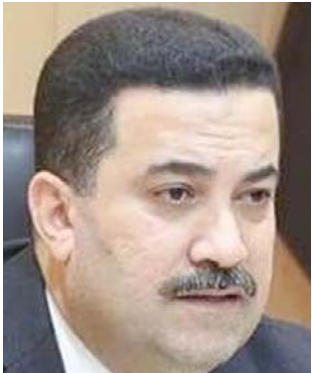
محمد شياع السوداني

البيان ان (الوزارة وفي اطار تنمية الشركات الناشئة والمشاريع الصغيرة اعلنت في شهر شباط من العام الحالي بدء التقديم على برنامج حاضنات الاعمال تم خلاله قبول 50 فكرة مشروع من المتقدمين عن طريق الموقع الالكتروني للوزارة بعد عرض المؤهلات والخبرات ونوع وطبيعة المشروع المطلوب استجابته للحاضنة والمساحة المطلوبة وعقد العمال بالإضافة الى حجم الاستثمار). وأوضح منعم ان (برنامج حاضنات الاعمال يستهدف الباحثين عن العمل من لديهم مشاريع تحمل افكاراً ابداعية سواء اكانت مشاريع خدمات او منتجات او نماذج عمل او اخراعات ضمن قطاعات الصناعة او التقنية والتصنيع والاتصالات والمعلومات والمصنع والطاقة واي تقنية تهدف الى استثمار المصادر المتوفرة وتحقق منفعة اقتصادية واجتماعية للبلد).