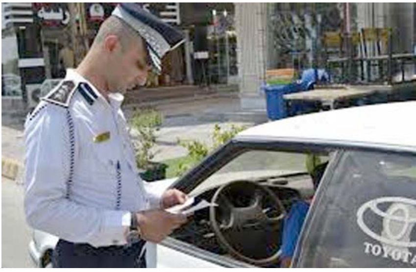
احدى ساحات مدينة كربلاء

السير وعدم حمل مستمسكات ثبوتية). وقال مصدر في المجلس لـ (الزمان) اس ان (البيان الخفائي للمجلس) اكد ضرورة اصلاح العملية تكون غير مقصودة من قبل المواطنين بسبب عدم معرفتهم بتعليمات وانظمة المرور). تجاوز مخالفات دعاها الى (ضرورة التحلي بالثقافة المرورية حتى يكون الأشخاص على علم تام بجميع المخالفات من اجل تجاوزها حفاظاً على سلامة الجميع وحتى لا يتم ارتكابها مرة اخرى لكي نحافظ على النظام العام). واعلن في محافظة كربلاء عن تشكيل مجلس أعلى للإتحادات والنقابات في المحافظة لتوحيد الرؤى والأفكار بغية الاهتمام