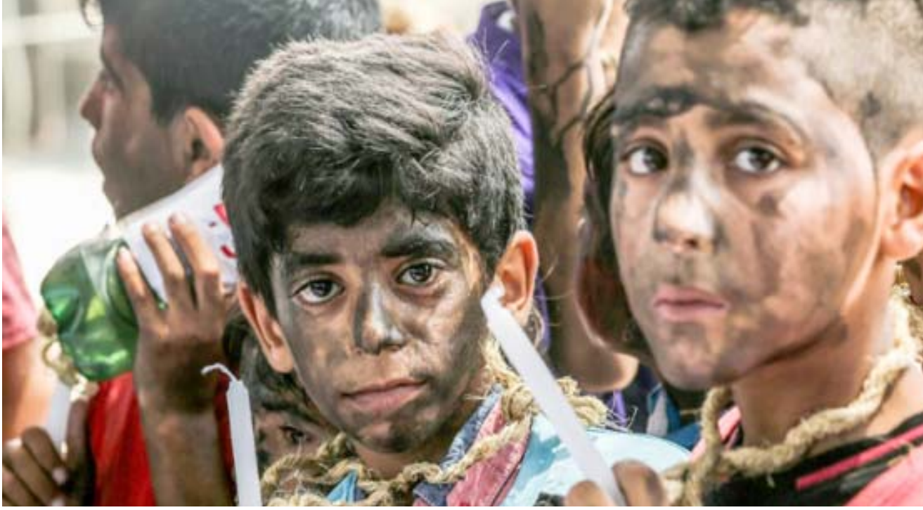
أطفال فلسطينيون خلال تظاهرة بالشموع عند معبر إيريز مع إسرائيل في شمال قطاع غزة

حياة شعبها للخطر. وأضاف ان كل ما ستحققه الاقتراحات الواردة في التقرير هو مساعدة الفلسطينيين على مواصلة رفضهم لدولة إسرائيل.