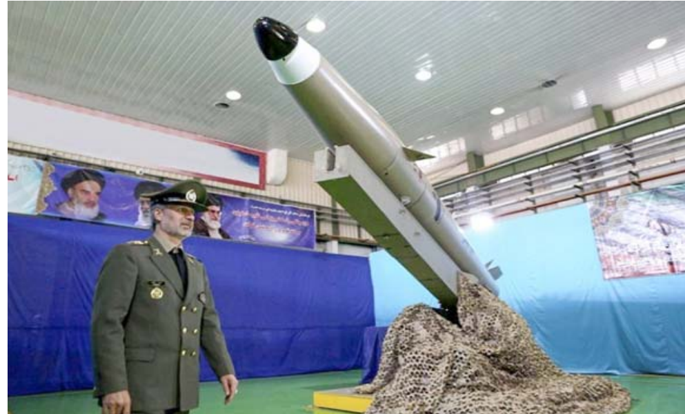
صورة وزيرها وزارة الدفاع الإيرانية ظريف وزير الدفاع أمير حاشي في أمام الجبل الجديد من صاروخ 'فاتح مبین' بالستي خلال مراسم الكشف عنه في طهران

والأميركية. ويأتي الإعلان بعدما أعادت واشنطن فرض العقوبات الاقتصادية على إيران الأسبوع الماضي عقب اعلان الرئيس الأميركي دونالد ترامب في أيار/مايو انسحاب بلاده من الاتفاق النووي المبرم بين طهران