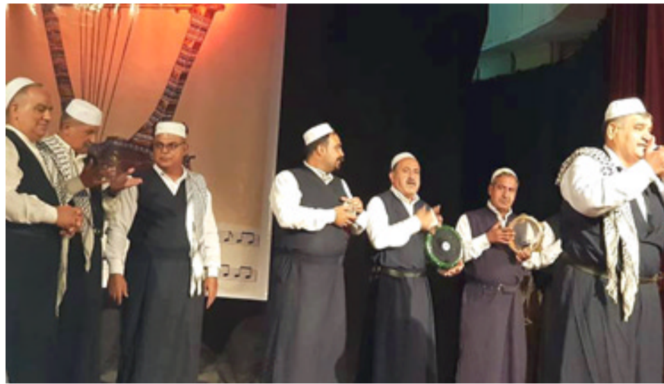
الحنان تراثية : فرقتا سومر والمربعات البغدادية على خشبة قاعة الرباط (الزمان)