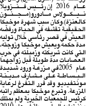
حوسيه مؤخيا ومعرفة كثرة وسلاح بي سي سي قائلا اعترض (اي زميل بما جرحته شخصيا في ثروة الحل)، وكان مؤخيا قد قدم في عام 2013 باعتذار الى رئيسة الأرجنتين في ذلك الوقت، كرسيتينا فرنانديز دي كيرش، بعد ان وصفها بأنها (عجوز بشعة)، كما اعترض لزوجها والرئيس السابق فيستور كيرشنر، الذي انشأها

اعلن رئيس اوروغواي السابق حوسيه مؤخيا عدم رغبته في الحصول على اي راتب تقاعدي عن خدمته التي اضاعها عضوا في مجلس الشيوخ، وكان مؤخيا الذي يطلق عليه لقب (أفق رئيس في العالم جراء اسلوب حياته شديد التقشف، قد تعدد استقالته يوم الثلاثاء من عضوية مجلس الشيوخ التي شغلها منذ عام 2015 بعد انتهاء مدة ولايته لرئاسة البلاد التي استمرت خمس سنوات. وقال انه لن يكمل مدته حتى 2020 لأنه (تعج بعد رحلة طويلة، وبلغ مؤخيا، وهو معارض يساري سابق من العمر 83 عاماً). وقد الرئيس السابق استقالته الرسمية في خطاب يرسله لرئيسة مجلس الشيوخ لوسيا توبولوفسكي. في ايامه في ارفع الاستقالة الشخصية، وهي تعج بعد ذلك، ونظرا لظن عقلي مازال يعمل، يكتفي الاستقالة من التضامن