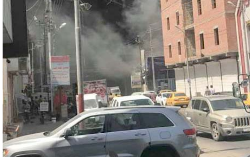
حريق : اعدده الدخان تلو سما منطقة في البصرة اثر حريق كبير