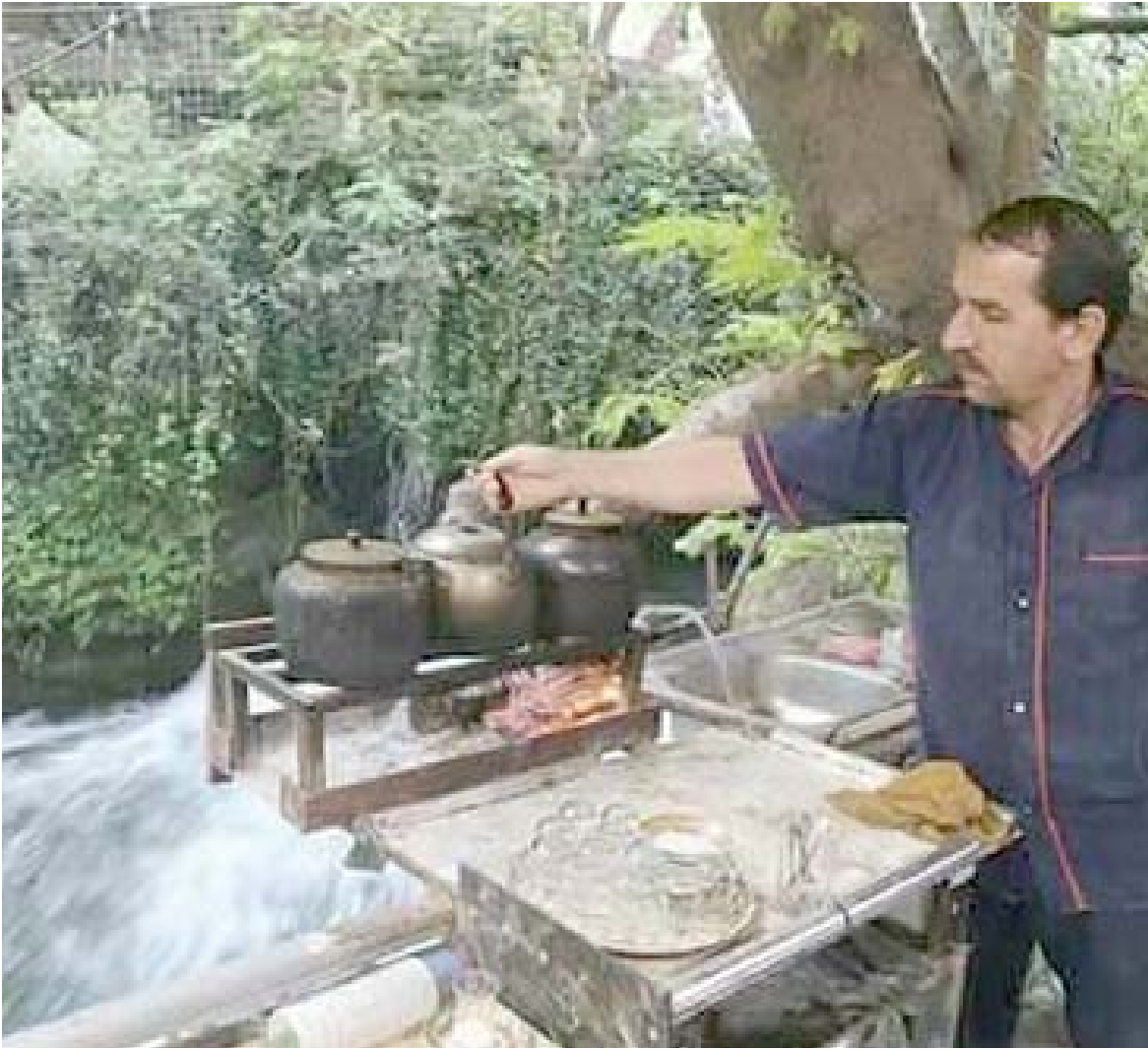
کسب قوت : باغ شاي في اقليم کردستان يهیب بضاعته لربانته

وكشفت المصادر السياسية عن اتفاق سائرون والنصر والتحالف الوطنية ونيار الحكمة الوطني واتحاد القوى العراقية على اغلب النقاط لتشكيل الكتلة الاكبر. وذكر مصدر في تصريح ل(الزمان) اس ان (هناك تشاغما من التحالف الذي سيكون عدده اكثر من 225 نائبا)، لافتا الى ان (كتلا اخرى ونوابا منفردين سينضمون للتحالف ومنهم بيارق الخير برئاسة خالد العبيدي وحركة الجيل الجديد وكتلة برهم صالح والنياب