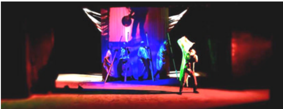
عمل متميز: مشاهد من مسرحية (أبصم باسم الله) (الزمان)