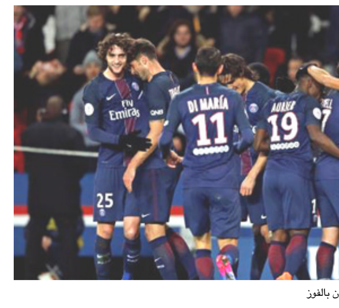
جانب من فرقة فريق باريس سان جيرمان بالفور