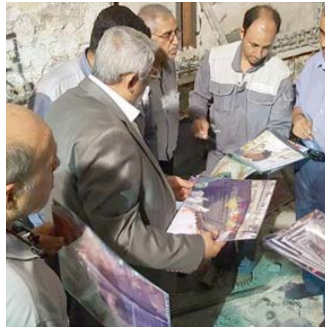
لجنة: اعضاء اللجنة الخاصة بصيانة العتبة الحسينية

وعن حكم شراء ما يعرض منها للبيع في الداخل او في الخارج؛ وإذًا لم يجوز شراء ما يعرض منها للبيع فهل يجوز دفع المال لغرض استئجارها؟ وإضاف ان (الجواب انه لا يجوز بل لابد من اعادته إلى المتحف العراقي ولا يصح شراؤه اي لا يصبح ملكا للمشتري فلو تسلمه وجب عليه ارجاعه إلى المتحف المذكور ولا يجوز ولكن لابد من اعادته ما يستندق منها إلى المتحف كما تقدم).