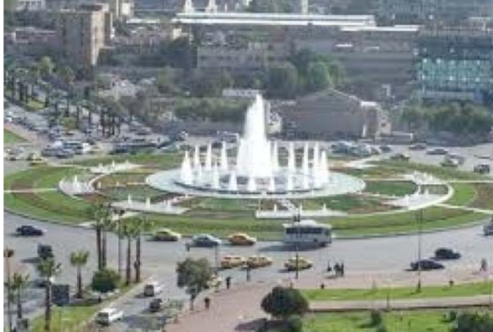
دمشق؛ مشهد من وسط العاصمة دمشق