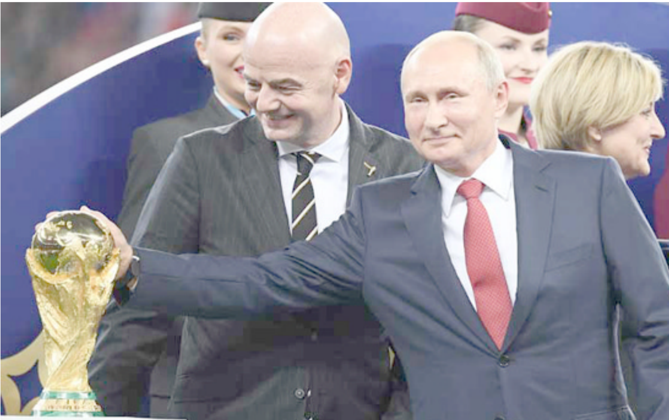
كأس: الرئيس الروسي ورئيس اتحاد كرة القدم الدولي بلامسان كأس العالم

بنهائي كأس العالم لكرة القدم، معبئاً ان اللاعبين الفرنسيين لعبوا كرة قدم رائعة. وقال في تغريدته على تويتر بعد فراق كرة قدم رائعة. "هنئ فرنسا فراقاً قبيحاً من انتهاء المباراة بين فرنسا وكرواتيا" 2018. التي لعبت كرة قدم رائعة، بفوزها في سبيلها/فبراير 2014. بعد فوزها في المباراة وكات فرنسا فازت في المباراة النهائية في موسكو على كرواتيا بربعة أهداف مقابل هدفين. وأضاف ترامب في تغريدته ان جهة ثانية أوجه التهاني أيضاً الى الرئيس بوتين وروسيا بهذا الفوز المميز فعلا لهذه الكأس، التي جاءت واحدة من الأفضل. ووصل ترامب الى هلسنكي لعقد قمة الاثنين مع نظيره الروسي فلاديمير بوتين في العاصمة الفنلندية.