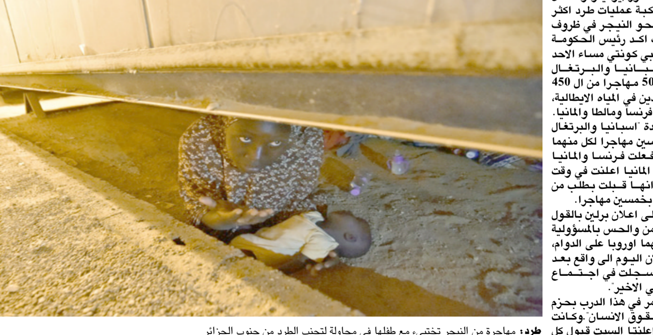
طرده: مهاجرة من النيجر تختبئ، مع طفلها في محاولة لتجنب الطرد من جنوب الجزائر

وتولت السلطات المحلية اسر النجريين فيما اتمعت منظمة الهجرة الدولية بالافارقة الاخرين، وفق المسؤول البلدي. وفي تغريدة الجمعة، اوضح ممثل منظمة الهجرة في النيجر جوزيبي لوبريتي ان وكالته ساعدت 391 مهاجراً من 16 جنسية تركوا على الحدود مع النيجر والجزائر. وبين