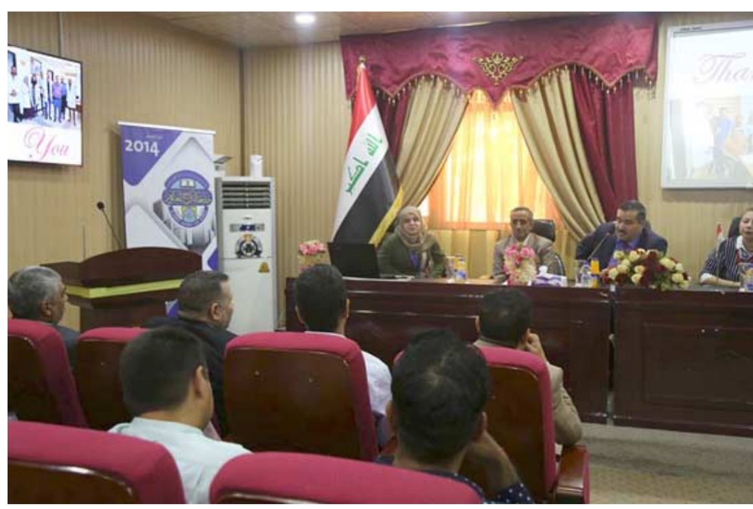
ندوة: المشاركون في ندوة ادارة المخاطر خلال جلسة الانتقاء