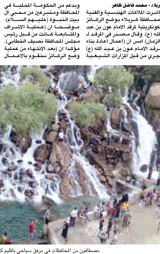
مصطفائون من المحافظات في مرقق سياحي باقليم كردستان