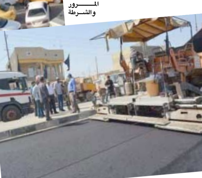
مخرج من دوارها باتجاه بيوتاتنا ونحن نمر بإزمة كهرباء وارتفاع درجات الحرارة ارضونا برحمتك الله ) مهندس في الطرق

والهروب من الازدحام وهذا ماضف واختناقات والمخالفات وبعد مرور ساعتين وصلت الى تقاطع جسر الكلية العسكرية الذي لايبعد اكثر من كيلو مترين عن تقاطع بغداد الجديدة وشارع محمد القاسم فتفاجأت بان الاسانة قطعت اجزاء من الشارع وجعلت المرور باتجاه واحد بحجة اكساء الشارع ، نعم مشكوة الامانة والمرور وكل الجهات المعنية ولكن لماذا في وقت النهار تقومون بعمليات الاساءة وخاصة ان وقت الليل مع توفير الإنارة الكاملة بواسطة مولداتكم المتخلفة تقومون بعملكم وخاصة ان الوضع الامني مستقر ولا توجد عمليات خطف ولق للعمال مثلا كان في السابق وهذا السؤال يردده جميع المواطنين الذين يتذمرون من عمليات الصيانة والكساء والتاهيل اثناء النهار بدلا من الليل متى تجد انسيابية ونحن