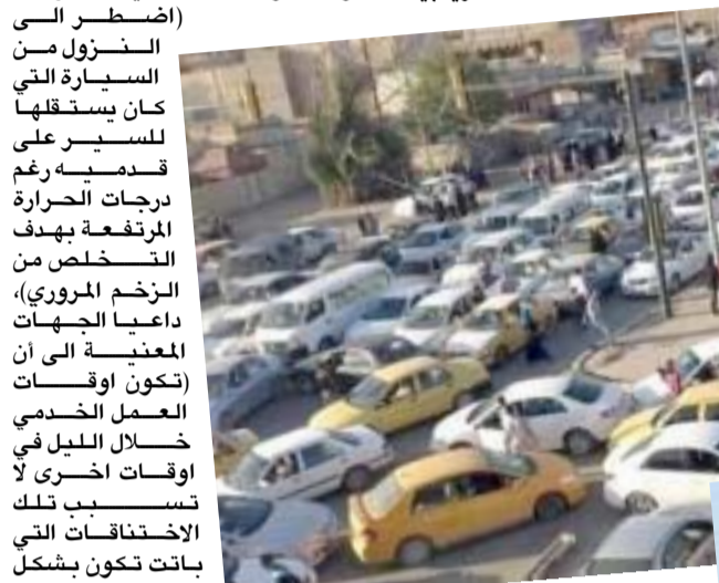
مواطنون يقترحون تغيير أوقات إكساء شوارع بغداد إلى المساء

اعمالنا ولايهم ان كان في الليل او النهار الا انهم هو التزام السائقين ( اننا نقوم بعمليات القطع لكساء بعض ممرات الشوارع بطريفة رسمية بحيث لا يؤثر على سير المركبات ولكن المشكلة الخلفيات التي التي تسبب ازمة خائفة فنجد ان البعض يسير عكس الاتجاه واخر يسير على الرصيف والترايب واخر يعوس عكس الشارع وكل هذا تاكيد هذا بسبب اختلافات مرورية وانسا استعنا برجال المرور والشريعة