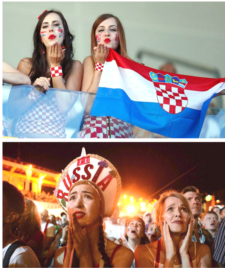
تشجيع: تتواصل عاشقات كرة القدم بتقديم الدعم لمنتخبات بلدانهن