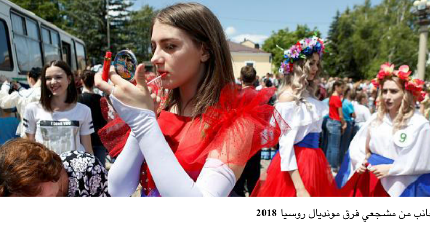
جانب من مشجعي فرق مونديال روسيا 2018