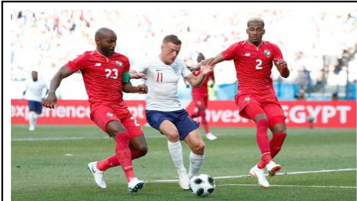
البيان تتعدل مع السنغال والحسابات تتعدّد في المجموعة الثامنة