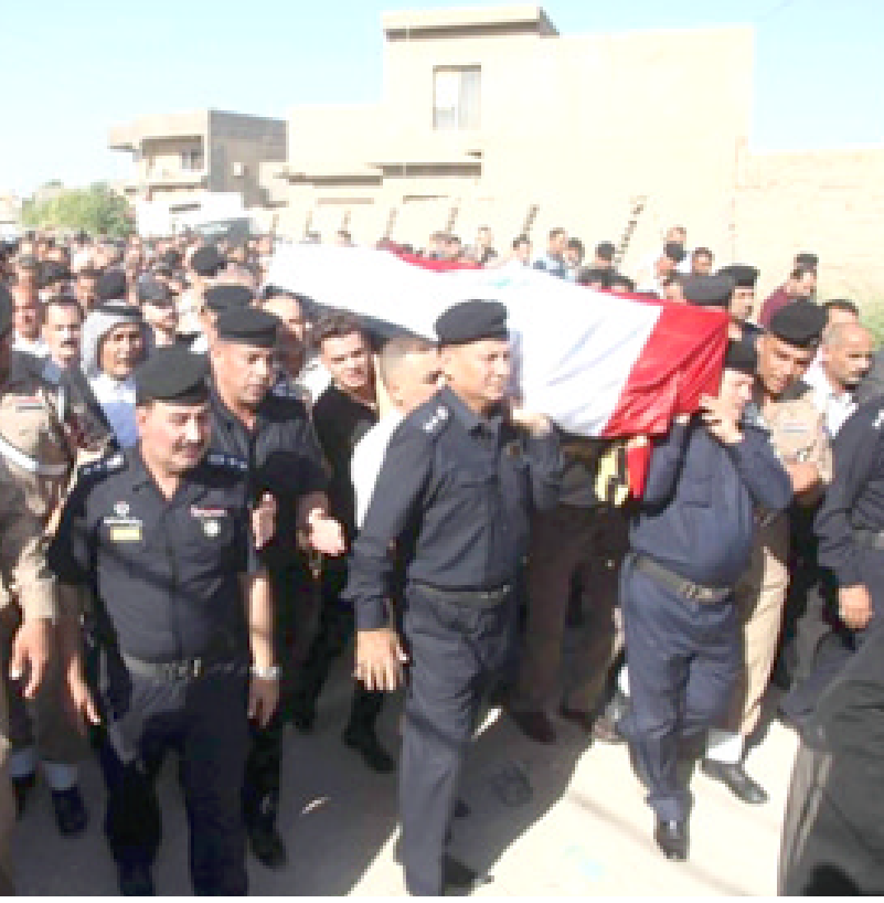
تشيع: ضباط بابل يشيعون زميلهم مدير الجوازات والجسبية

العاصمة بغداد، متورطاً براتباته بعصابات الخطف حيث يتكفل ببيع عجلات المخطوفين، كما انه متهم أيضا بعمليات اختطاف