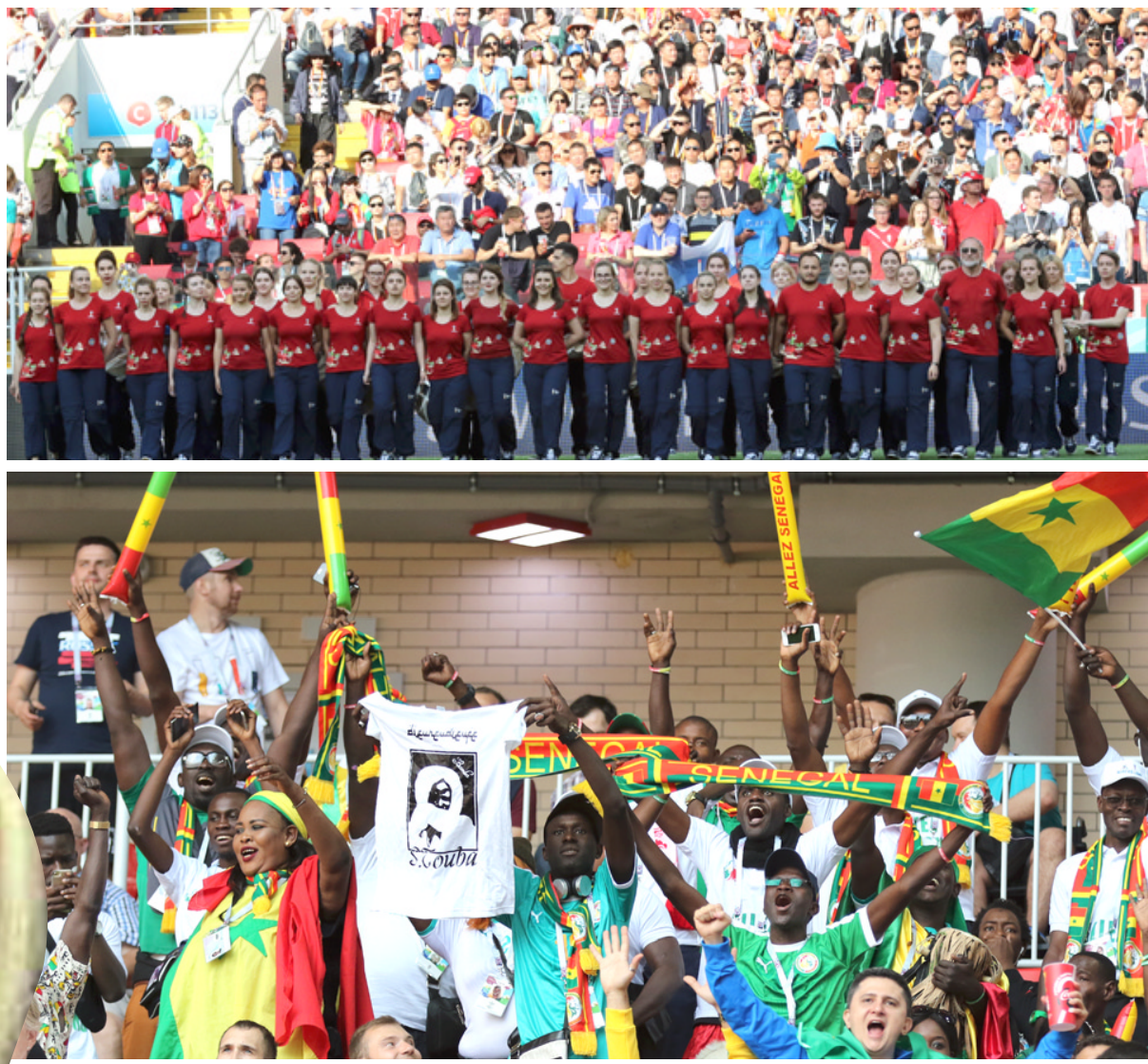
أفراج : مشجعون من مختلف دول العالم يشعرون بالبهجة عند فوز فريق بلدانهم عسمة (الزمان) قحطان سليم