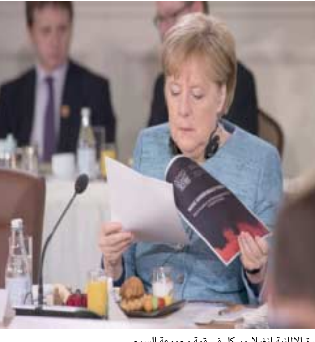
الاستشارة الألمانية انغيلا ميركل في قمة مجموعة السبع