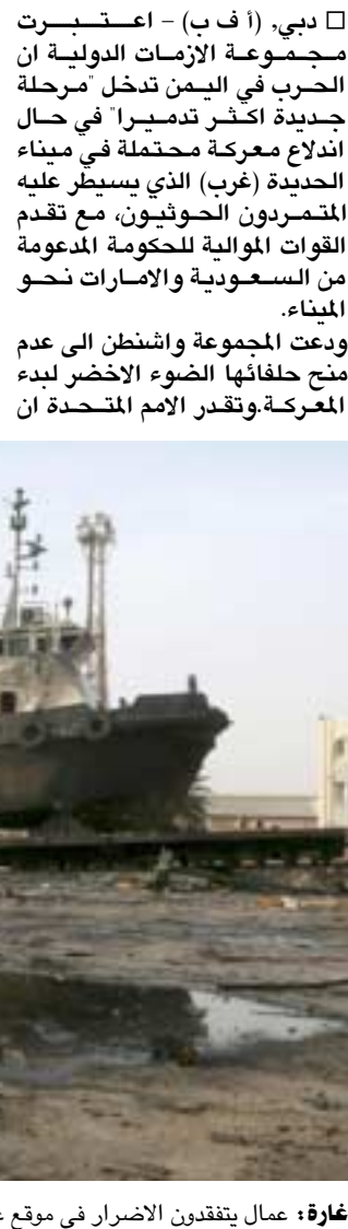
غارة: عمال يفتقدون الاضرار في موقع غارة في مرفا الحديدة

هناك قرابة 600 ألف مدني يعيشون في الحديدة والمناطق القريبة. ويعتبر ميناء مدينة الحديدة المدخل الرئيسي للمساعدات المتجهة الى المناطق الواقعة تحت سلطة الحوثيين في البلد الفقير. لكن التحالف يرى فيه منطلقاً لعمليات عسكرية يشنها الحوثيون على سفن في البحر الأحمر. وقالت المجموعة في تقرير ان المعركة من أجل الحديدة من