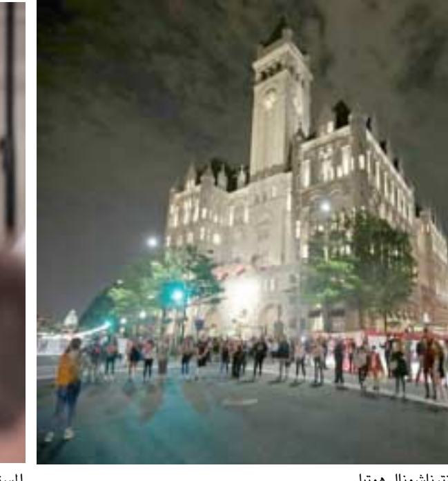
فندق ترامب إترناشونال هوتيل