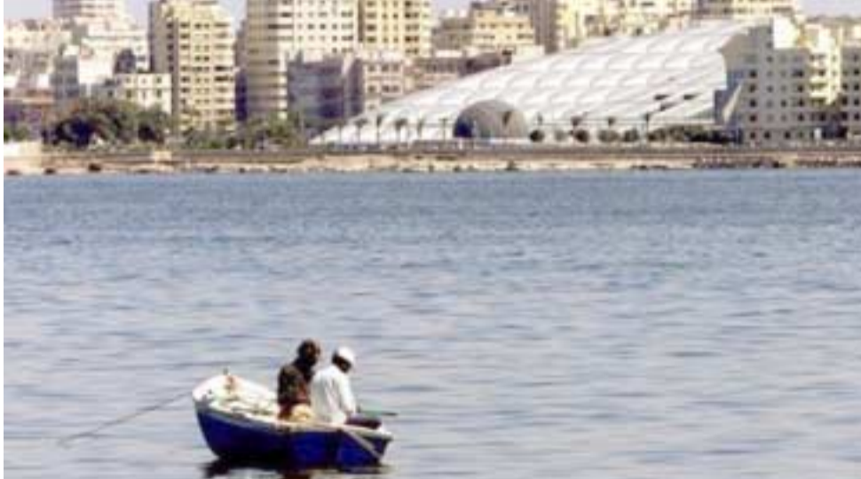
قارب صيد يمر في مياه البحر المتوسط أمام مكتبة الإسكندرية

مع الإسكندرية وتنوعا يجذب مزيدا من السياح. وإذا أضفنا مقابر العلماء ومدينة مارينا غربي الإسكندرية والأبيرة، فإن هذا يعني أن الإسكندرية وما جاورها يمكن أن تكون مقصدا سياحيا متنوعا يمكن أن يزورها السياح أكثر من مرة.