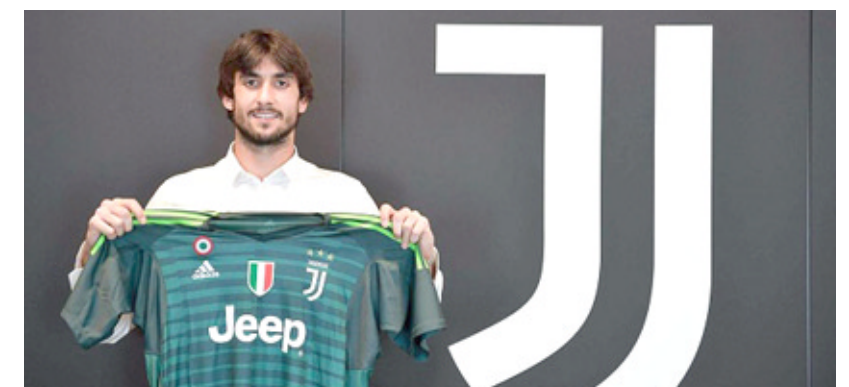
حارس الرمي ماتيا بيرين يحمل قميص السيدة العجوز

□ روما - وكالات: أعلن نادي يوفنتوس، مساء أول أمس الجمعة، التعاقد مع الحارس ماتيا بيرين، قادماً من جنوى، بعقد يمتد حتى عام 2022. وقال يوفنتوس في بيان رسمي عبر موقعه على الإنترنت: تم التوصل