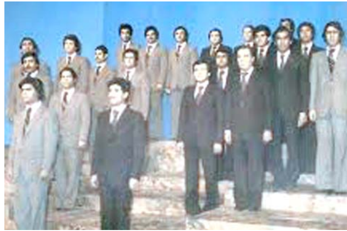
اعضاء فرقة الانشاد العراقية