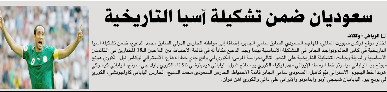
اختار موقع فوكس سبورتنج العالمي، المهاجم السعودي السابق سامي الجابر، إضافة إلى مواطنه الحارس الدولي السابق محمد الدعيع، ضمن تشكيلة آسيا التاريخية في كأس العالم وتواجد الجابر في التشكيلة الأساسية بينما وجد الدعيع مكاناً له في قائمة الاحتياط، بين اللاعبين الـ 18 المختارين في القائمتين الأساسية والبدئية وجاءت التشكيلة التاريخية على النحو التالي: حراسة المرمى الكوري لي وانج جاي خط الدفاع الأسترالي لوكاس نيل، الكوري هونغ مينج يو، الياباني مياموتو خط الوسط الإيراني ميهديفا، الكوري يو سانج شول، الياباني هيديتشي تاكاتا، الكوري بارك يو سونغ، الياباني كيسيكي هوندا خط الهجوم الأسترالي تيم كاهيل، السعودي سامي الجابر قائدة الاحتياط، الحارس السعودي محمد الدعيع، الحارس الياباني كاجاويتشي الكوري لي يونج يو، الياباني شينجي آينو وإياماموتو والإيراني علي دائي والكوري آهن هوان.