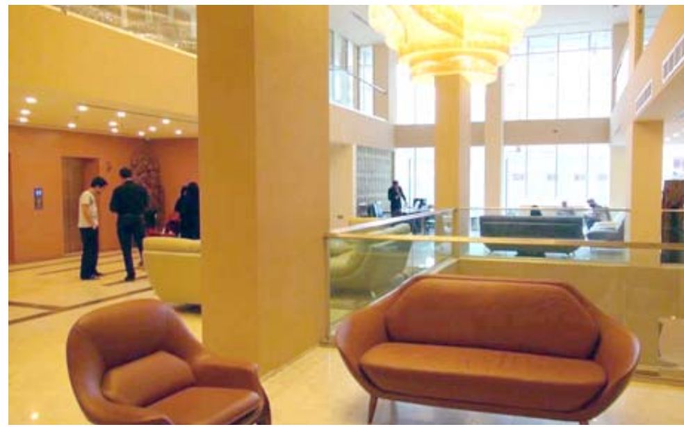
داخل : المول العظيم من الداخل بعد افتتاحه

الافتتاح ان يصل عددهم الى 500 عامل واكثر واغلبهم من العمالة العراقية ومن كلا الجنسين وهؤلاء سوف تضاف لرونظمة خبراتهم خبرات اخرى متراكمة استفوتها من خبراء مختصين من الذين استفوتهم ادارة المول سواء من الفلبين او مصر او سورية ولبنان من الذين لديهم خبرات في بيع التجزئة- (الهياير) مؤكدا ان هذا الهياير لايتخلف عن نظائره في دول الخليج العربي ان لم يكن افضل منها) وردا على سؤال بشأن ما قدمته هيئة استثمار النجف من دعم ومساندة للمشروع ، اجاب جاد بالقول (وجدنا تعاوناً كبيراً من هيئة الاستثمار ورئيسها ضرغام تكو وملاكه المتميز والزلات الهيئة تقدم المساندة والدعم لنا للمشروع عبارة عن مشاركة فحسبنا نتجح معنى هذا ان الهيئة قد نجحت) . اما عن الفندق فهو يحتوي على 56 جناحاً بصنف 5 نجوم وصالات استقبال وقاعات للاجتماعات والمؤتمرات ومنظمة تدفئة وتبريد مركزية بنظام تحكم الكتروني ناهيك عن وجود منظومة حماية وانذار مبكر ضد الحرائق هذا من غير الخدمة المميزة التي سقدم لنزلاء الفندق بوجود ملاكات تدربوا خارج العراق على ايدي خبراء عالميين في مجال السياحة والفنقة والايكيت السياحية الذي تقالف من سلسلة من المطاعم لتقديم الاطعمة السريعة وتقدم الاكلات اللبنانية الشهيرة بملاكات لبنانية) . مضيفا ان (الذائقة العراقية تجاه مدير المطاعم والخدمات العامة على