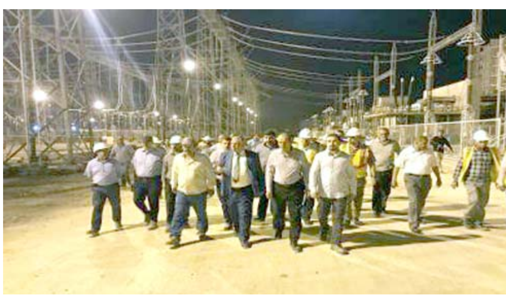
جولة : وكيل وزارة الكهرباء لشؤون الإنتاج والتوزيع خلال جولته في محطة الرميلا الكهربائية

التي (مواصلة ملاكات مديرية شعبة نقل كهرباء كربلاء اعمال اضافية محولة رابعة في محطة جنوب كربلاء . كما انجزت مديرية توزيع كهرباء جنوب كربلاء معالجة اعطاب الغنذيات واعداد محطة التمرود الثانوية في العمل، بحسب المدرس الذي أكد اصلاح مصدر محطة التمرود جهد 33 كلف واعادتها للعمل ليعمل على اصلاح مغذي جنوب كربلاء التحويلية. وقال بيان تلقته(الزمان) امس عن المتحدث الرسمي باسم الوزارة مصعب سرسي الحدردسي قوله ان (ملاكات مديرية شعبة نقل كهرباء بابل باشرت اعمال الصيانة الدورية للمنتقلة اليابانية في محطة جنوب الحلة التحويلية) ، وأشار