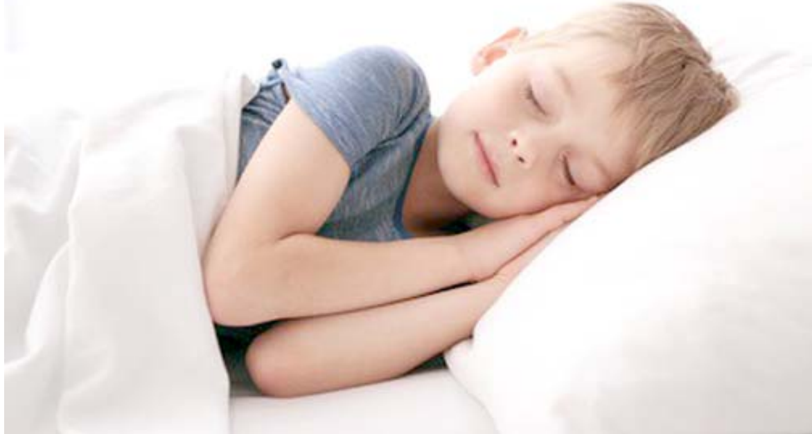
لندن - الزمان

كشفت دراسة طبية حديثة عن ان النوم لمدة قصيرة جدا يمكن ان يزيد من خطر إصابة الأطفال بالسمنة. وقالت الدكتورة ميشيل ميلر الأستاذ المشارك في الدراسة بجامعة «وارويك» في بريطانيا «إنه يمكن أن تؤدي زيادة الوزن إلى أمراض قلبية وعائية، ومرض السكر من النمط الثاني الذي يزداد أيضا بين الأطفال؟«مشيرة إلى ان نتائج الدراسة لفتت إلى ان النوم قد يكون أحد العوامل الخطرة المهمة للسمنة في المستقبل. واستعرض الفريق البحثي نحو 42 دراسة شملت أكثر من 75000 طفل، تراوحت أعمارهم ما بين 3- 18 عاما، تم متابعتهم لنحو 3 سنوات، ولوحظ اكتساب الأطفال -الذين حصلوا على أقل نسبة من ساعات النوم الموصى بها- المزيد من الوزن، ومن المرجح ان يصابوا بالسمنة بنسبة تصل إلى 58 بالمئة أكثر من أولئك الذين يحصلون على قسط وافر من النوم من الأطفال.