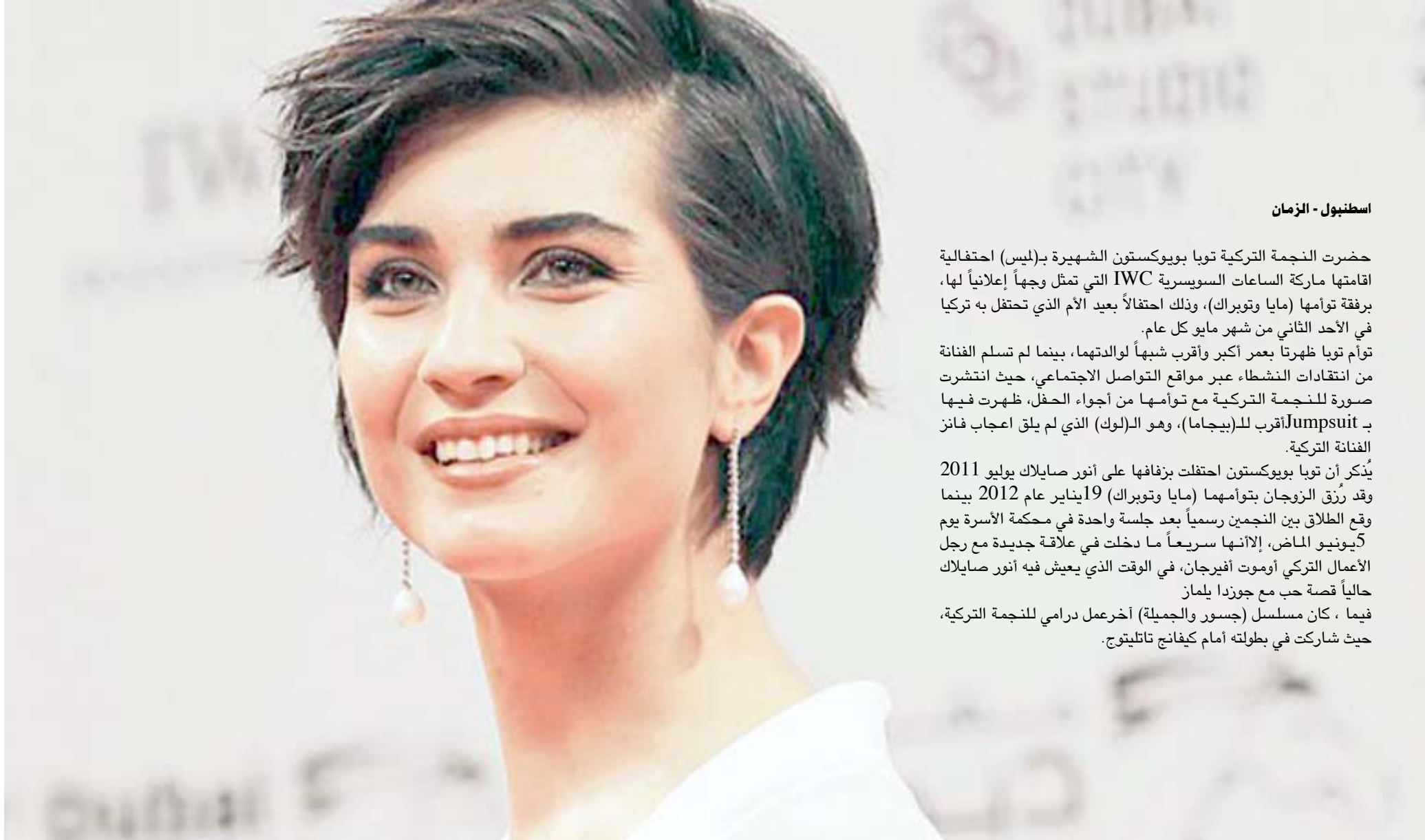
استنبول - الزمان

حضرت النجمة التركية توبا بويوكستون الشهيرة بد(ليس) احتفالية اقامتها ماركة الساعات السويسرية IWC التي تمثل وجهها إعلانياً لها، برفقة توأمها (مايا وتوبراك)، وذلك احتفالاً بعيد الأم الذي يحتفل به تركيا في الأحد الثاني من شهر مايو كل عام. توأم توبا ظهرتا بعمر أكبر وأقرب شبيهاً لوالديهما، بينما لم تسلم الفنانة من انتقادات النشطاء عبر مواقع التواصل الاجتماعي، حيث انتشرت صورة للنجمة التركية مع توأمها من أجواء الحفل، ظهرت فيها بـ jumpsuit أقرب للـ (لبجامة)، وهو اللوك الذي لم يلق إعجاب فنانز الفنانة التركية. يذكر أن توبا بويوكستون احتفلت بزفافها على أنور صايلاك يوليو 2011 وقد رزق الزوجان بتوأمهما (مايا وتوبراك) 19 يناير عام 2012 بينما وقع الطلاق بين النجمين رسمياً بعد جلسة واحدة في محكمة الأسرة يوم 5 يونيو الماضي، لإناتها سريعاً ما دخلت في علاقة جديدة مع رجل الأعمال التركي أموت أفيرجان، في الوقت الذي يعيش فيه أنور صايلاك حالياً قصة حب مع جوزدا يلماز فيما ، كان مسلسل (جسور الجميلة) أخرج عمل درامي للنجمة التركية، حيث شاركت في بطولته أمام كيفانج تالتيتوج.