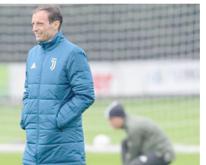
مدرب يوفنتوس الإيطالي أليري يرغب بتدريب أرسنال

وارتبط أليري بتدريب أرسنال منذ الصيف الماضي، لكن أرسين فينجر وقع عقداً جديداً مع المدفعية، كما قام يوفنتوس بالحفاظ على أليري أيضاً. ولا يريد أرسنال الاستعجال في تعيين مدرب جديد للنادي، ويريد التحدث مع كل المدربين المرشحين، خاصة أن هناك الكثير من الأسماء ومنها باتريك فييرا وتييري هنري ومايكل ارتيتا وجوليان ناچلزمان وزييلكو بوفاتش وبرندان رونجرن وبياتريك لوف.