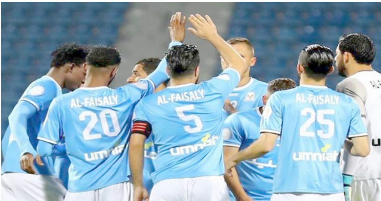
تعال: فرح للفريق الفيصلي الأردني بنتيجة التعادل في الاتحاد الآسيوي

الدولي في العاصمة في ذهاب الدور نصف النهائي لبطولة كأس الإتحاد الآسيوي لكرة القدم.