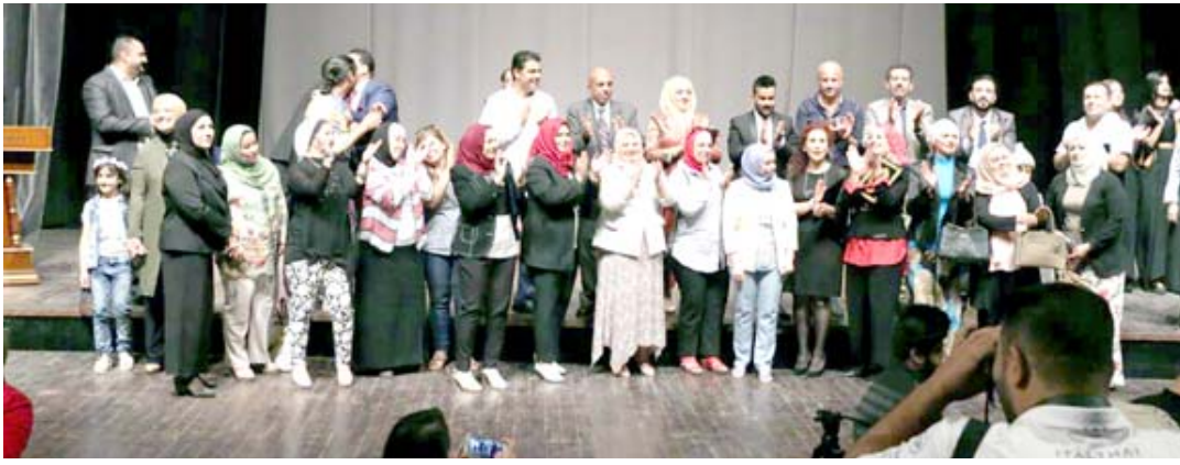
مهرجان : أسرة معهد الفنون الجميلة على خشبة المسرح في ختام عروضها الفنية

من جهة أخرى شارك الممثل أحمد عز في حملة إعلانية لصالح أحد الهواتف المحمولة، وقد تعرض لإنتقادات بعد عرض الإعلان وتعقيباً على ذلك قال عن لموقع الفن ( أنه متعجب لأن معظم نجوم السينما العالمية والمصرية قدموا إعلانات دعائية، ولكنه يرى بأن المهم هو الاختيار واسلوب الإعلان نفسه، كما أنه ليس مع أن يقدم الفنان 50 إعلاناً فيحرق توجهه وتمثيله، ولكن عليه أن يختار سلعة محترمة وعالية، ولذلك هو دائماً ما يختار نمونجاً معيناً لا يرى بأنه تضرر من الأمر، كما أن الإعلانات ليست عيباً ولا حراماً ولا يرى بأنها تقلل من شأن الممثل أو الفنان .