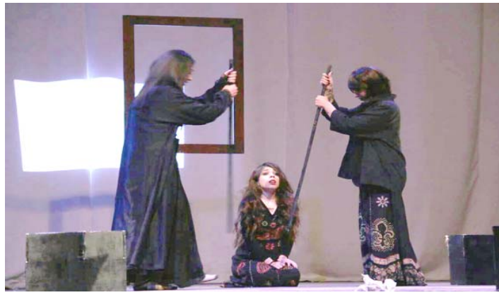
عروض سينمائية ومسرحية ورقصات فولكلورية تزين الكرنفال