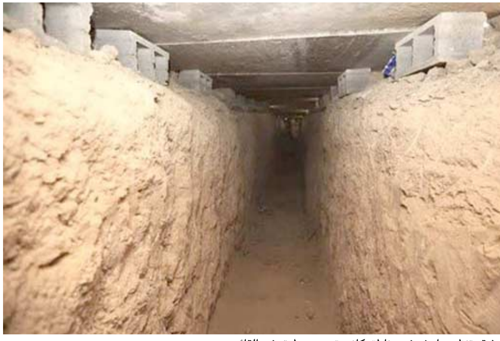
مناطق، نفق شقة تنظيم داعش في مناطق كانت تحت سيطرته في القائم

شمالى بغداد.وقال المصدر في تصريح امس ان (قوة امنية تمكنت من العثور على جثة رجل مجهول الهوية مرمية بالحصى الساحات الترابية المتروكة ضمن حي البساتين التابع لمنطقة (الشعب)، مشيراً الى ان (الجثة بدت عليها اثار طعنات سكين بمنطقة مختلفة من الجسم). ويشان اخر القت القوات الامنية القبض على احد المطلوبين في حي الإصلاح الزراعي في نينوى وقال الناطق باسم مركز الاعلام الامني العميد يحيى رسول، في بيان امس ان (قيادة العمليات الفت القبض على احد المطلوبين في حي الإصلاح الزراعي، وعثرت قوة اخرى خلال عملية تفحيش قرية - البريدية - على كسب للعتاد مدفون يحتوي 11 قنبرة هاون عيار 12 ملمترا وقدفتي مدفع عيار 155 ملمترا)، و اضاف ان (القوات العراقية عثرت وخلال عملية تطهير منطقة عين الجحش على 3 براسيل مملوغة بالمتفجرات ولغرين ضد الدروع وعبوتين ناسفتين، كما عثرت القوات الامنية في قيادة ذاتها على 8 عبوات ناسفة محلية الصنع في منطقة بعشيقه تم تفجيرها موقعيا).