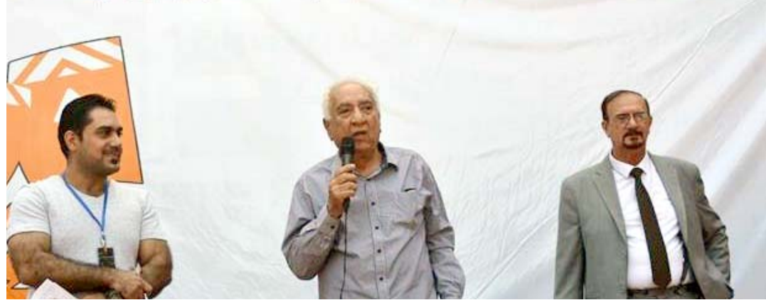
عروض مسرحية: سامي عبد الحميد يلقي كلمة في افتتاح مهرجان مسرح الشارع الدولي

جمع "فنانو العراق" يقيم مهرجان مسرح الشارع ببغداد