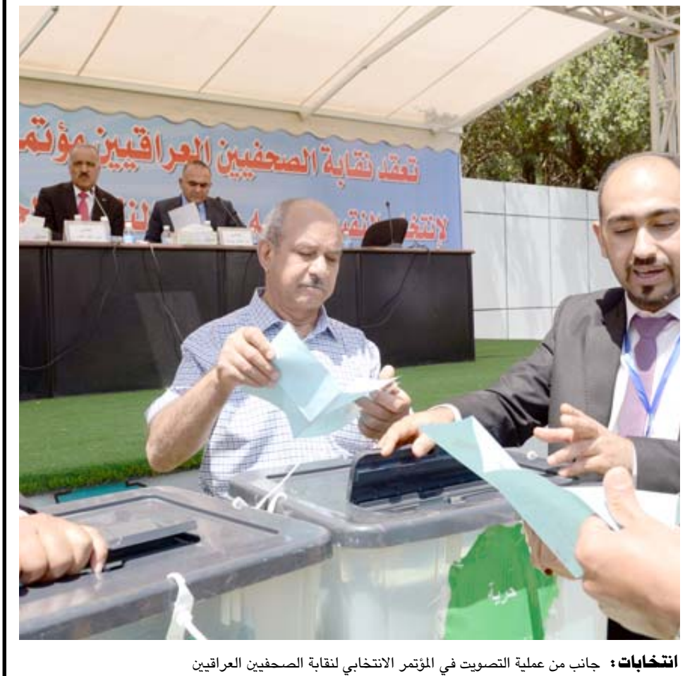
انتخابات : جانب من عملية التصويت في المؤتمر الانتخابي لقادة الصحفيين العراقيين