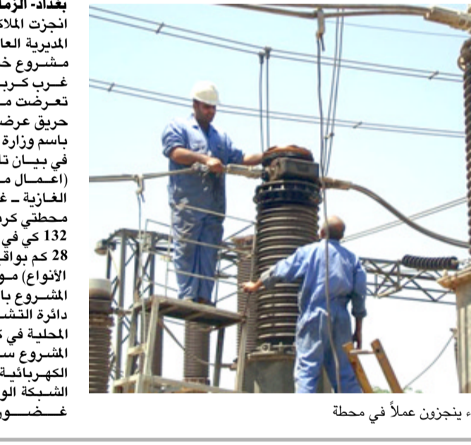
عمال الكهرباء ينجزون عملاً في محطة