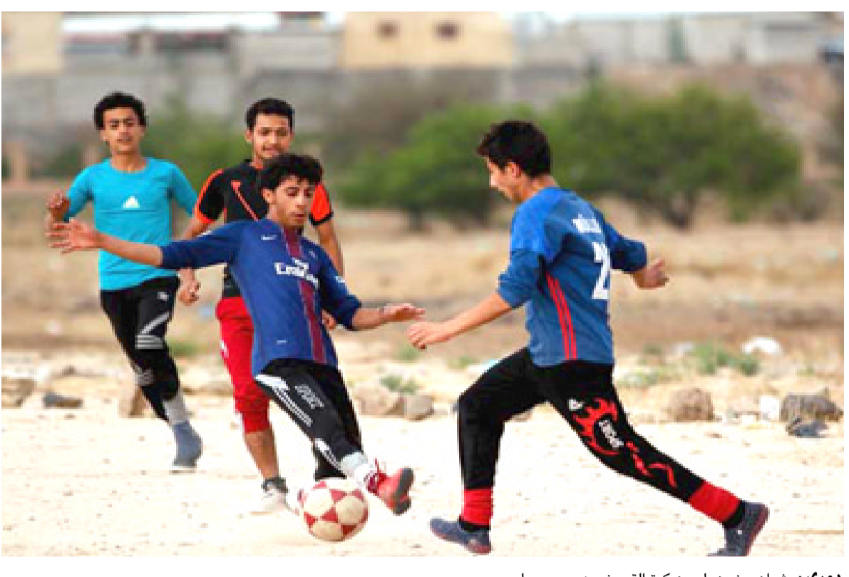
دوري: شبان يمنيون يلعبون كرة القدم ضمن دوري محلي

الذي يسببون منذ ابول 2014 على العاصمة صنعاء ومناطق اخرى. وشهد النزاع تصعبا مع تدخل السعودية على رأس تحالف عسكري في آذار 2015 دعما للحكومة المعترف بها. كما استغلت جماعات متطرفة بينها تنظيم القاعدة وتنظيم الدولة الاسلامية الحرب لتعزير نفوذها في هذا البلد. ويبلغ عدد سكان اليمن اكثر من 27 مليون نسمة، نصفهم دون سن الـ 18. وقسطل في النزاع منذ التدخل السعودي نحو عشرة الاف شخص بينهم اكثر من 1500 طفل. وفقا لمنظمة الامم المتحدة للطولة يونيسف. وتسببت الحرب ايضا بازمنة انسانية هي بحسب الامم المتحدة من بين الاكبر في العالم.