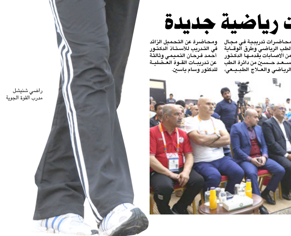
جانب من حفل افتتاح الدورة الدولية بالمصارعة

بغداد - الزمان استقبل رئيس مجلس النواب سليم الجبوري أول أمس الأحد، وفد الاتحاد العراقي لكرة القدم برئاسة عبد الخالق مسعود، وذكر المكتب الإعلامي للجبوري في بيان صدره أنه (جرى خلال اللقاء استعراض واقع الكرة العراقية والطموحات المستقبلية التي يسعى الاتحاد إلى تحقيقها، وإهمية استمرار الدعم والسنادة من أجل تحقيق آمال وتطلعات الشارع الرياضي). وتم رئيس مجلس النواب بحسب البيان (جهود الاتحاد العراقي في رفع الحظر عن الملاعب، مؤكداً ان المجلس حرص طوال دوره الحالية وحتى الآن على منح الرياضة مساحة كافية من الاهتمام، لافتاً إلى ان هناك تشريعات تخص الشأن الرياضي كانت محط الانتظار وذلك من أجل دعم الرياضة ونموها وروادها). كما تمت مناقشة أهمية التعاون من أجل انجاح انتخابات الاتحاد وفق السياقات القانونية المتبعة، وسبل النهوض بالكرة العراقية خصوصاً بعد