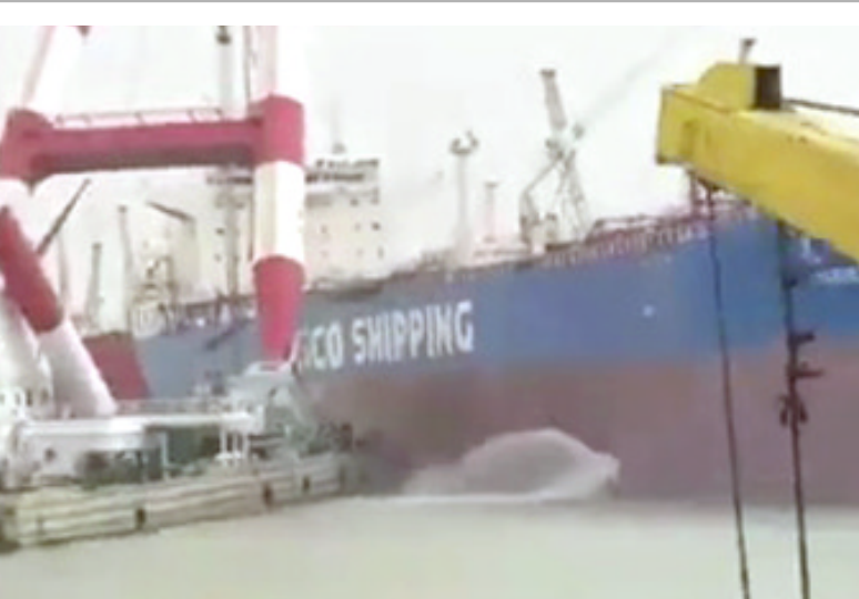
خور: الباخرة الأجنبية في ميناء خور الزبير

بغداد - الزمان عزت وزارة النقل حادثة انحراف الرفاعة العملاقة ابا ذر وارطامها بياخرة في ميناء خور الزبير الخسيس الماضي الى سوء الاحوال الجوية، وزيادة سرعة الرياح حيث كانت تتراوح بين 80 - 90 عقدة. وقالت تريعة استخدام الاسلحة طفيفة جدا) نافية حدوث اي (تسرب لمادة البنزين من الباخرة وان ما حدث هو تسرب لمياه الموازنة وعلى إثر ذلك قامت فرقة