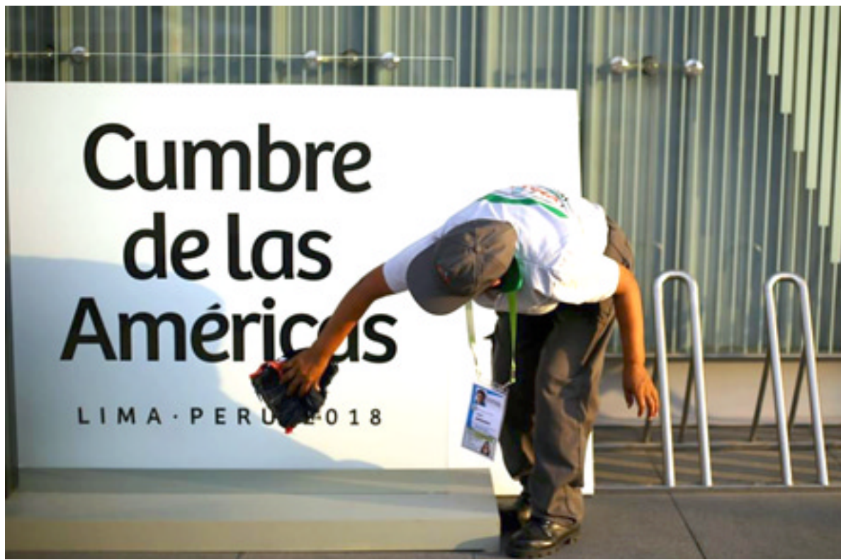
تنظيف: عامل ينظف لوحة القمة

اقتصادي ليد من مواجهته بالتحالف مع دول المنطقة إضافة إلى دخول الاستثمارات الإيرانية أيضا إلى الكثير من دول أمريكا اللاتينية ومنطقة الكاريبي التي تعد أكثر خطورة من الاستثمارات الصينية.. ان التراجع الاقتصادي الأمريكي واضح على الصعيد الداخلي وعلى الصعيد الدولي في جميع القارات هل بدأت مرحلة الازمة الأمريكية مع بداية القرن الحادي والعشرين؟ تأمل ذلك.