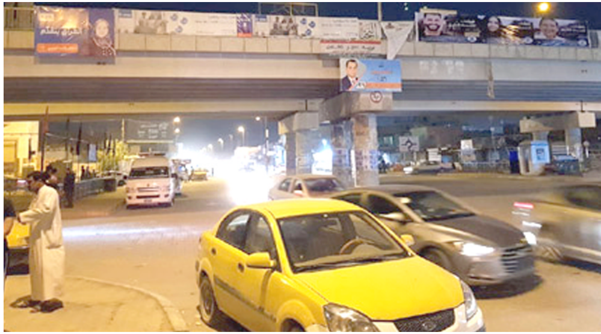
طرق: إعلانات المرشحين تلغ الميسرات والطر

الخبرة من تحديث سجلات الناخبين زخما كبيرا من المواطنين لتحديث سجلاتهم في خطوة منه للتغيير لان ترك الوضع على ماهو عليه معناه تصويت جماهير الاحزاب لمرشحهم والبقاء على الوجهة القديمة وهو امر لن يصب بمصلحة المواطن والشعب العراقي ومعناه بقاء الفساد وتقص الكفاءة في دوما لم تبن من فراغ بل هي خطة محكمة ليس المستهدف بها النظام السوري فقط بل هي تسير لايعد من هذا)، مشيراً