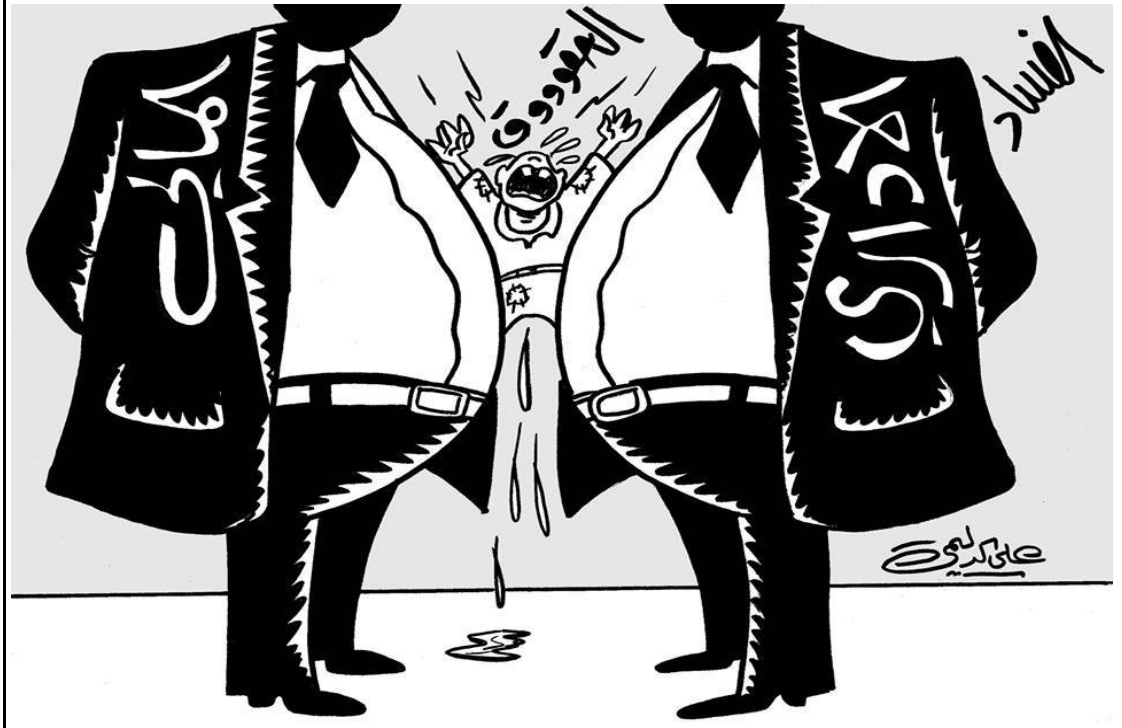
من اعمال لفنان علي الدليمي

- أبداً .. لا أذكر في يوم ما قد منع أو رفض لي أي كاريكاتير، وكانت جميع رسوماتي لها رد فعل من قبل الآخرين.. أما رسوماتي السياسية ضد (الحصار) والعدوان الأمريكي، التي كنت أنشرها في جريدة (بغداد أوبزيرفر) الناطقة باللغة الإنكليزية في العقد التسعيني، فقد أثارت إنبتهاب الشبكات الفضائية الأجنبية العاملة في بغداد، حيث أجرت معي لقاءات صحفية عديدة.