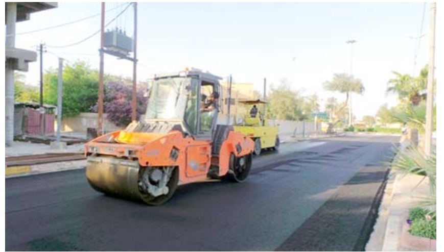
حملة : ملاكات امانة بغداد تنفذ حملة لتاهيل شوارع العاصمة