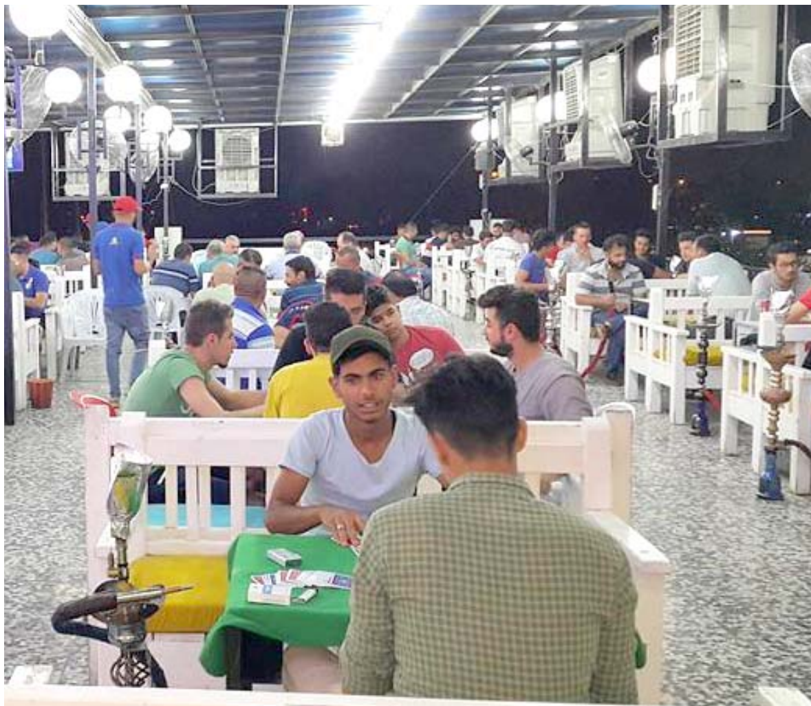
وقت : شباب يقضون اوقات فراغهم في المقاهي