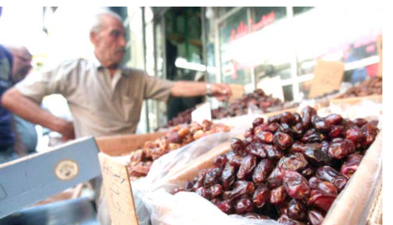
تمور مستوردة في اسواق البصرة

تضرر انتاج التمور في العراق نتيجة عوامل كثيرة اهمها عدم العناية بالنخيل وعدم وجود اباد عاملة تعتني بالاشجار وعدم مكافحة آفات النخيل سنوياً وامتناع الجهات المعنية عن مكافحة آفات النخيل