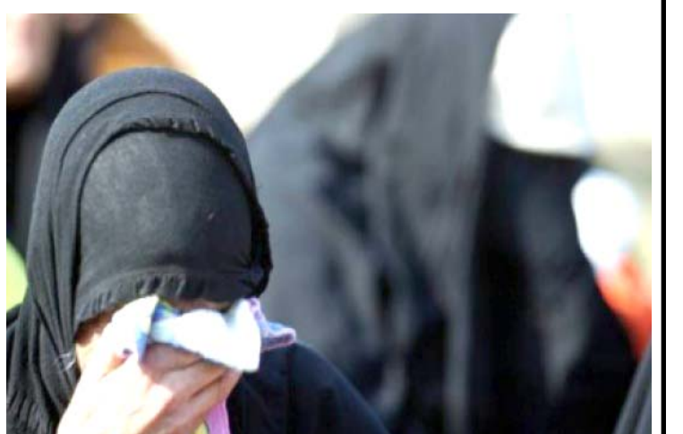
ارملة عراقية تبكي