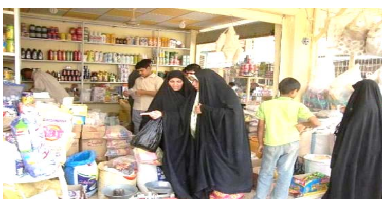
اقبال ملحوظ على شراء السلع

توفير قوت الشعب من الارض العراقية بايدي عاملة تزرع وتحصد والاخر استثمار الغاز وتصديره بدلاً من احتراقه ونهبه سدى لا بالملاريات ، تطوير انتاج الفوسفات والكبريت وتصديره ، وهناك امر مهم للغاية الا وهو تحريك عجلة الانتاج الصناعي من خلال تاهيل العمال والمصانع لاستيعاب العمالة العراقية والقضاء على البطالة وتوفير مبالغ الاستيراد .