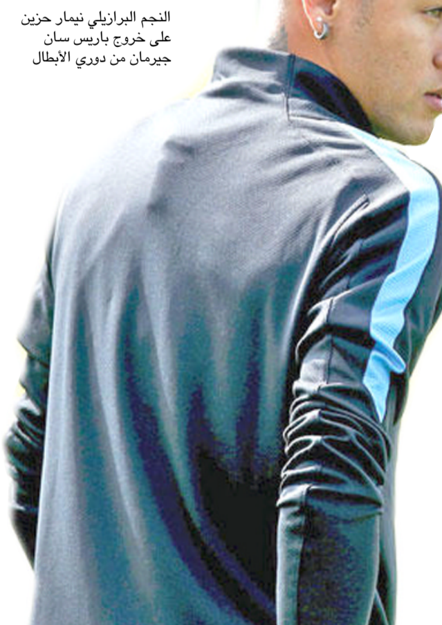
النجم البرازيلي نيمار حزين على خروج باريس سان جيرمان من دوري الأبطال

عائينا على المستوى البدني، لا يمكن أن تضمن نتيجة اللقاء، حتى لو تقدمت بهدف، بعد حالة الطرد، وختم من فرض السيطرة بشكل أكبر. وختم راموس حديثه بقوله زيدان يعطين معنا يومياً، وبعلم بإمكانه تقديم أجل مساعدة زملائي في الفريق، لكن زين الدين زيدان، المدير الفني لريال مدريد، التحقنا للاعبين فريقه، بعد بلوغ ربع نهائي دوري الأبطال، على حساب باريس سان جيرمان الفرنسي. ونجح الفريق الملكي، في تجاوز عقبة سان جيرمان، بالفوز عليه نهائياً 3-1 في البرنابيو، و2-1 إياباً. وقال زيدان، في تصريحات صحفية ماركا، إن فريقه قدم مباراة قوية وجادة للغاية، مشيراً إلى أهمية الفوز، الذي تحقق.