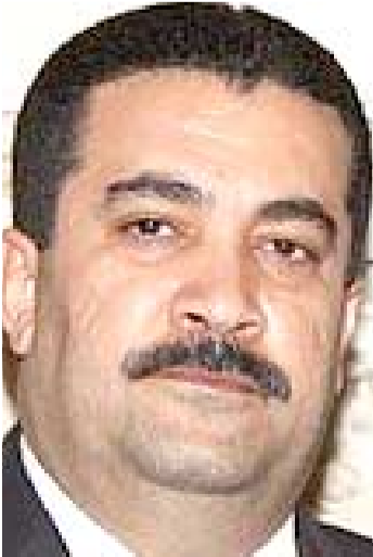
محمد شياع السوداني