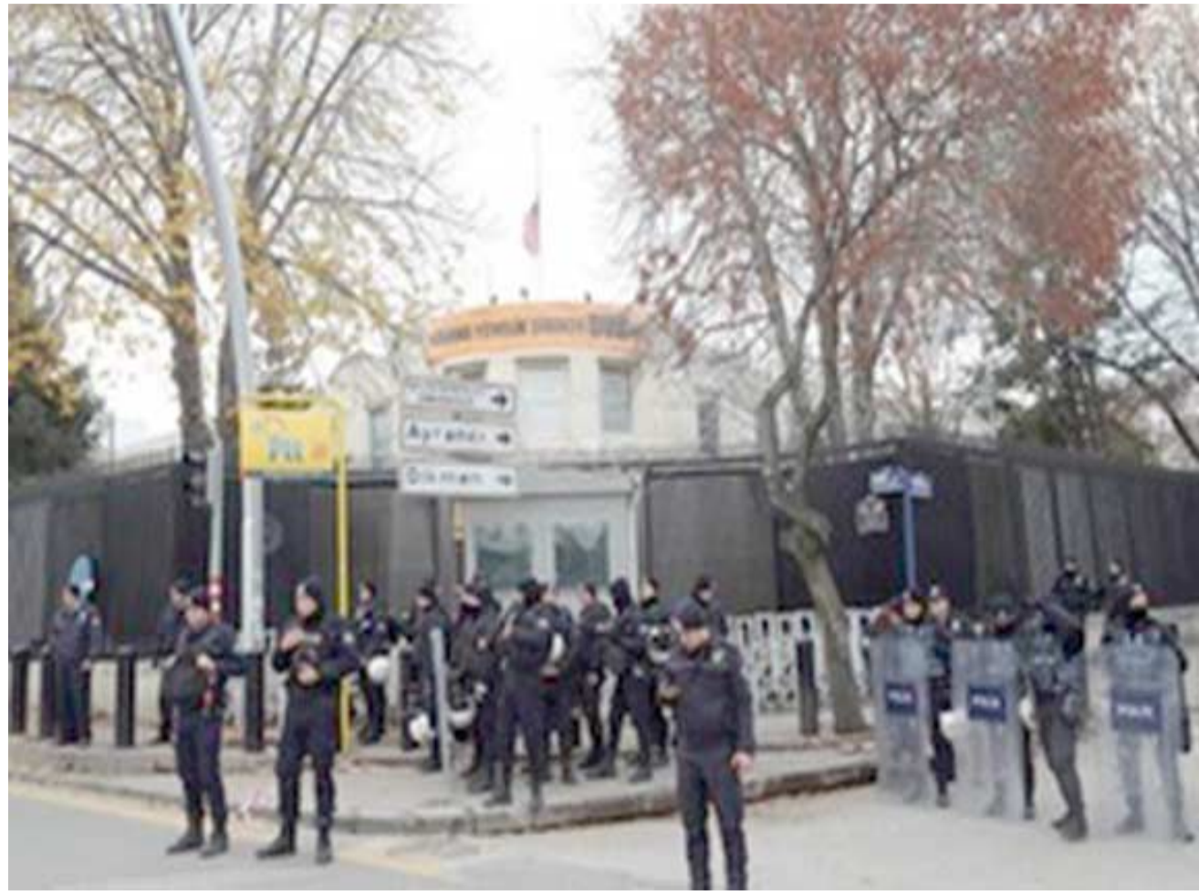
اعتصام، عناصر من شرطة مكافحة الشغب التركية أمام السفارة الأمريكية لدى أنقرة خلال اعتصام

المتحدة. ينتظر سكان المعقل في الغوطة الشرقية الأئتين وصول قافلة إنسانية تشتمل 46 شاحنة تحمل المواد الصحية بالإضافة لمواد غذائية تكفي لـ 500.27 شخص حسبما أعلنت الأمم المتحدة.