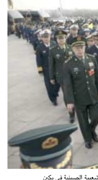
جلسة؛ الممثلون العسكريون عند وصولهم لحضور الجلسة السنوية للجمعية الوطنية الشعبية الصينية في بكين

راس السلطة طالما يشاء. ومن الغتعرض ان يحصل شي الذي تعهد بان يصبح الجيش من المستوى العالمي بحلول 2050، على إلغاء السقف المحدد بولائتين رئاسيتين خلال الجلسة السنوية للبرلمان التي افتتحت اعمالها