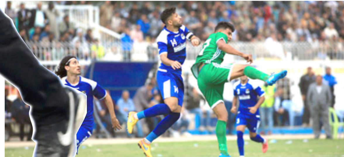
جانب من لقاء سابق للنف في الدوري الممتاز