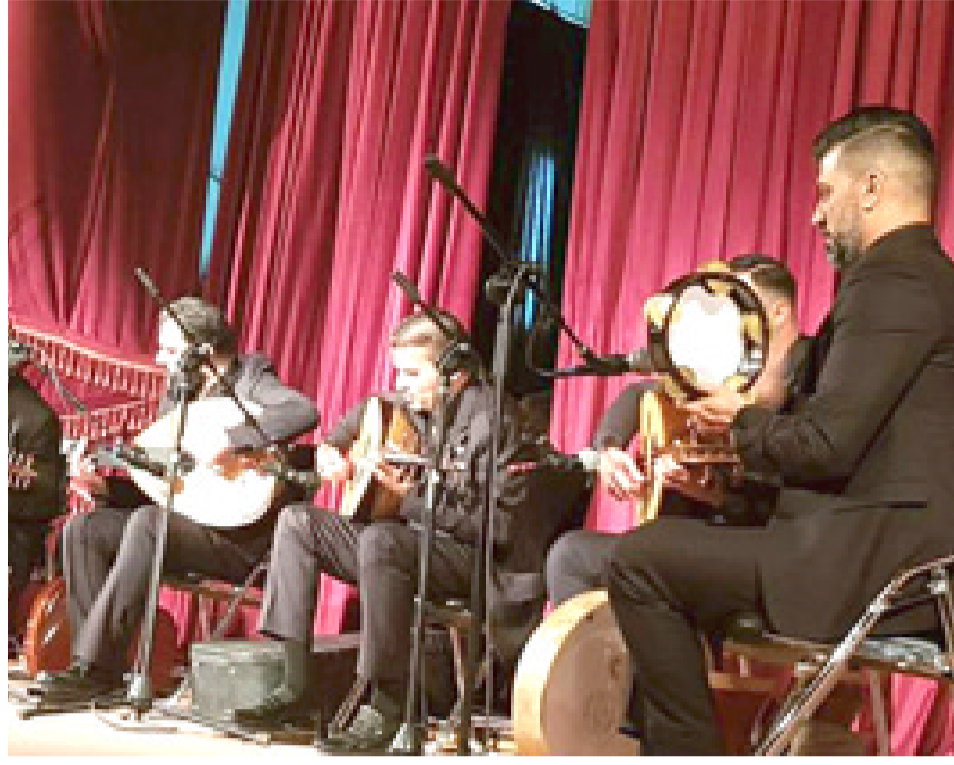
أمسية متميزة: الحضور يتفاعل مع انغام الموسيقى الأصلية