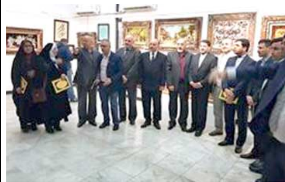
معرض: جانب من معرض السجاد الإيراني في بغداد